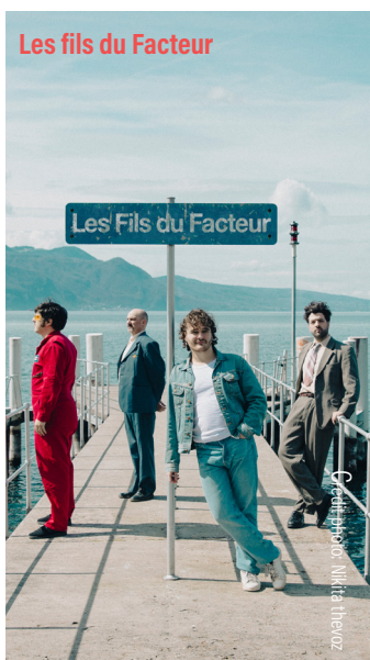
Les fils du Facteur