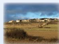
Arrivée sur Mérigneux