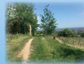
Lodge de Saillant