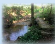
Passerelle sur la Vidrèsonne

A la sortie du parking, descendre en direction de la salle d'animation. Au bout du parking, au panneau « vitesse 30 », prendre le petit sentier descendant et suivre la route jusqu'au pont sur la Vidrèsonne. Dans le virage, suivre la direction « Mérigneux, Valensanges » par le chemin en face (ignorer le départ de droite).