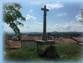
Croix de Mérigneux