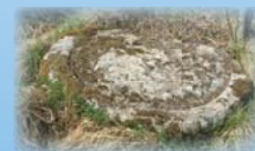
Pierre en forme de meule de moulin