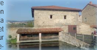
Lavoir du début du XX siècle Croix enchâssée de 1633 en façade du bâtiment