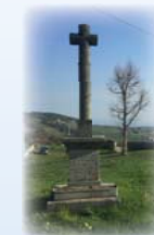
Croix de Mérieux