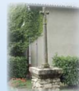
Croix de la Verchère

① Continuer tout droit sur le chemin qui devient goudronné. En haut de la côte, passer devant la croix des Banchets, (la plus ancienne croix de Lézigneux, datant du XIV siècle). Magnifique vue sur la plaine du Forez et sur l'étang de Vidrieux.