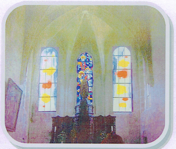
Implantation des deux maquettes de chaque côté du vitrail existant. Motifs demandés par la DRAC