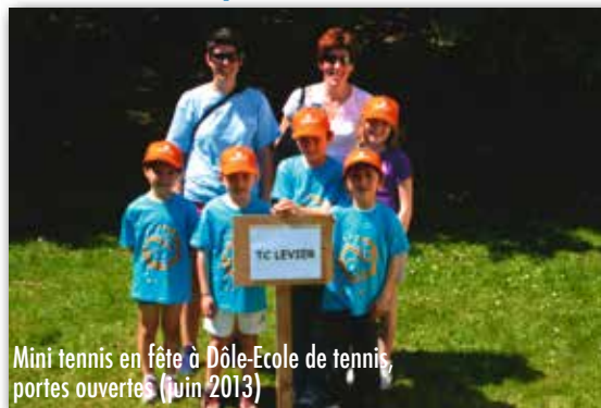
Mini tennis en fête à Dôle-Ecole de tennis, portes ouvertes (juin 2013)

03 81 49 57 41 - jeanclaude.faire@wanadoo.fr