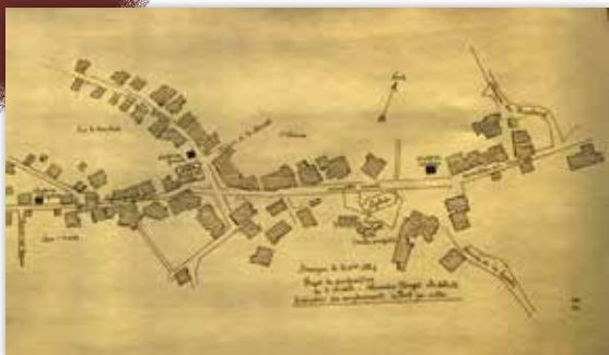
Au XIX e siècle

Au niveau financière, la commune est fortement endettée. 10 000 livres de dettes en l'An X avec des créanciers qui accourent de Paris, Arbois, Salins. Une contribution volontaire est sollicitée auprès des habitants pour payer les frais d'un procès de bois et une contribution foncière. Le budget de l'An XIII avec 1 568 fr de recettes et 6 142 fr de dépenses accentue encore ce déséquilibre. En 1839 il reste encore plus d'une soixantaine de vieilles créances à solder.