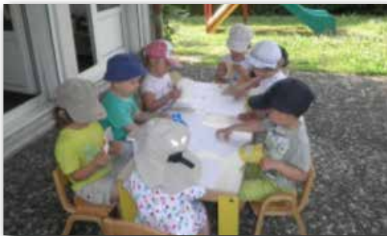
Été 2013- Activité créative à l'ombre de la micro-crèche

Actuellement, 22 enfants fréquentent la structure en accueil régulier ou occasionnel et d'autres sont attendus dans les semaines à venir.