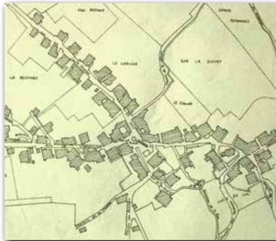
Au XVIII e siècle

Mais ce qui va marquer durablement l'histoire est le partage des espaces communs. Lorsque le droit à la propriété fut proclamé, certains habitants s'approprièrent des terrains avant la décision définitive par vote de la municipalité. Le conseil demanda au Directoire de Pontarlier le 5 mai 1793 de vendre les terrains communaux et les terrains d'aisance à l'intérieur du village. Ce sont 146 riverains qui achetèrent ceux-ci pour 5 333 livres. Restaient les communaux qui occupaient une surface de 1292 journaux et servaient de parcours pour 4 grands troupeaux. Ils furent répartis en 1 087 lots tirés au sort à partir de 5 h du matin le 14 août 1795. Tous les habitants eurent droit à un lot et parmi les patronymes des ayants droit se trouvent ainsi 53 noms de Jeannin, 34 de Laresche, 23 de Rousset, 21 de Prévalet, 19 noms de Manche, 12 de Suty... En février 1802 le conseil municipal demandera l'annulation du partage, même démarche en 1805, mais les terrains défrichés et cultivés ne pouvaient plus redevenir des parcours pour les troupeaux. L'accès à la propriété individuelle pour cultiver contribua ainsi à améliorer la situation alimentaire et économique d'un grand nombre d'habitants.