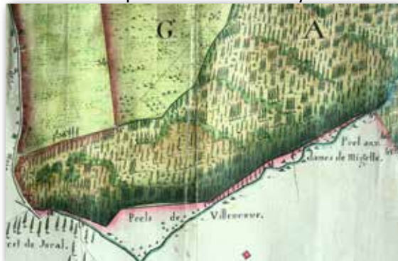
Au XVII e siècle

Le château de saint Anne est détruit en 1677 par ordre de Louis XIV et Montmahoux est une ruine.