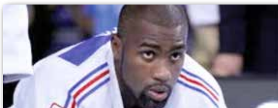
Teddy Riner, notre champion du Monde 2013

Le 30 juin se déroulera notre Assemblée Générale.