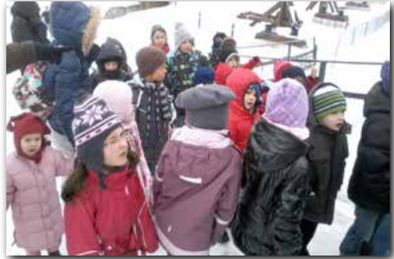
Visite du château de Joux

avec la réalisation de leurs propres jeux comme un memory et une chasse au trésor dans le musée de "la vache qui rit" à LONS le SAUNIER. Durant l'été "L'art dans tous ces états" a pu être découvert par les enfants inscrits. En particulier, l'art de la récup avec la fabrication d'un papillon en cannettes, l'art de grimper aux arbres avec la sortie au parcours aventure de Métabief et également l'art du camping avec une nuit sous la tente.