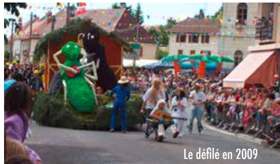
Le défilé en 2009

Pour les réservations des locations le lundi ou le vendredi de 19h30 à 20h30 avec David Prévalet.