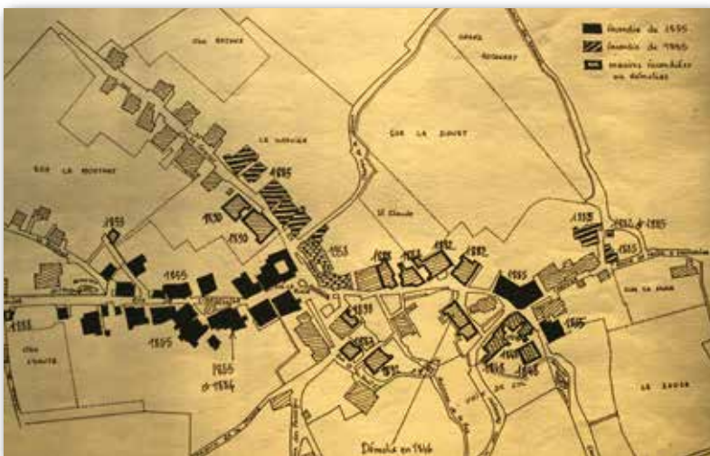
Au XIX e siècle

Après la révolution, les deux bâtiments communaux se trouvent dans un état lamentable. Malgré les dettes, la commune se décide à construire une première école de garçons et maison commune, la première mairie, en 1820 au 10 rue de Pontarlier actuel et d'entreprendre la réfection totale de l'église en la rehaussant et en l'agrandissant (église actuelle). La vieille tour est détruite et deux maisons sont expropriées et démolies (square de l'église actuel). Une coupe extraordinaire de 800 pieds d'arbres rapporte la somme de 73 900 fr pour cette construction dont le nouveau clocher en chantier présente sans cesse des malfaçons. Elles sont constatées en 1829, 1849, 1850, 1854 et donnent lieu à d'interminables procès avec les différents entrepreneurs et cela jusqu'en 1870.