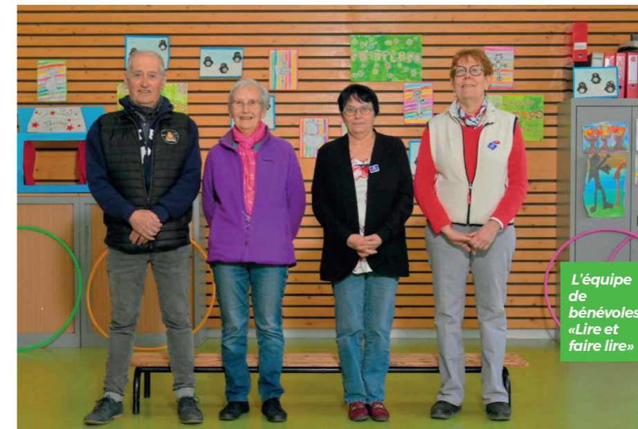
L'équipe de bénévoles «Lire et faire lire»

Enfin, la mise en place prochaine d'un vélo bus sur la commune et les travaux réalisés autour d'ABC Bauges et l'inventaire de la biodiversité, poussent nos jeunes vers une citoyenneté responsable et respectueuse de l'environnement. Le nouveau projet d'école pour les 4 à 5 ans à venir sera présenté lors du prochain conseil d'école qui aura lieu fin Juin. 95 à 97 enfants sont inscrits pour la rentrée 2025 répartis sur nos 4 classes.