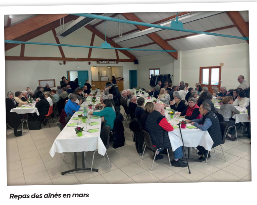
Repas des aînés en mars

Six manches qui se déroulent dans toute la France. Vesoul - 10 et 11 mai (4e sur 40) Croix en Ternois - 7 et 8 juin Le Val d'Argenton - 5 et 6 juillet Luby Osmets - 26 et 27 juillet Calmont - 30 et 31 août Charade - 20 et 21 septembre