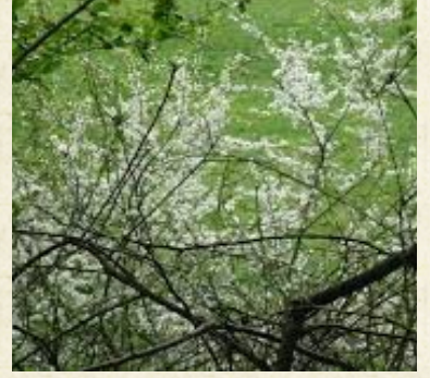
Fleurs de prunellier, épine noire ( Prunus spinosa )