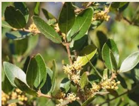
Fleurs de filaire à feuilles larges ( Phillyrea angustifolia )