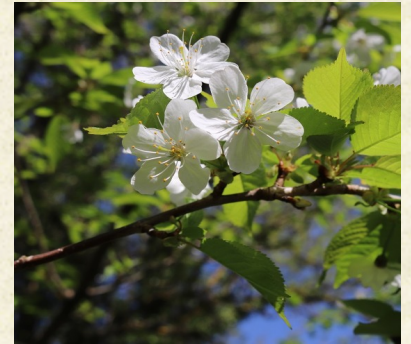
Fleurs de merisier, ou cerisier des oiseaux ( Prunus avium )