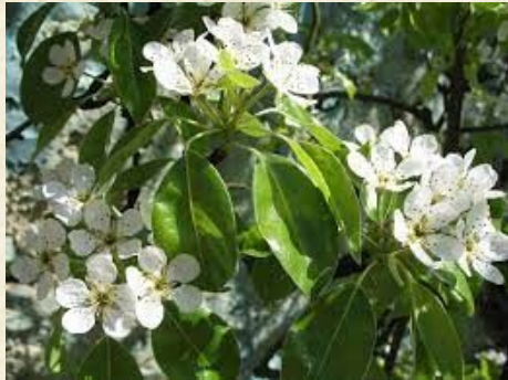
Fleur de poirier sauvage ( Pyrus pyraster )