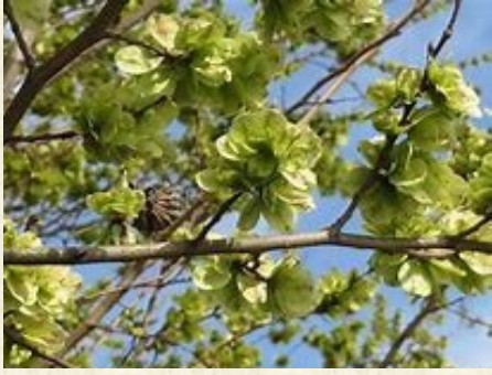
Samares d'orme champêtre, ormeau, petit orme ou ipréau ( Ulmus minor )