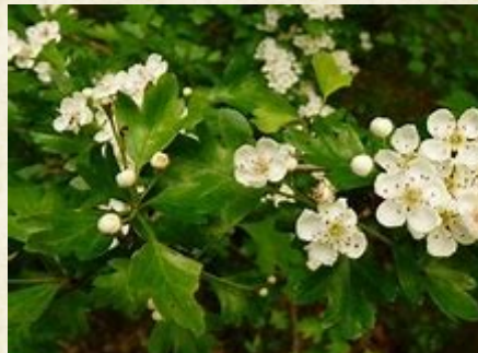
Aubépine à un style ( Crataegus monogyna )