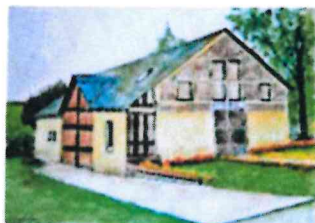
Mairie de Plainval