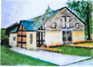
Mairie de Plainval