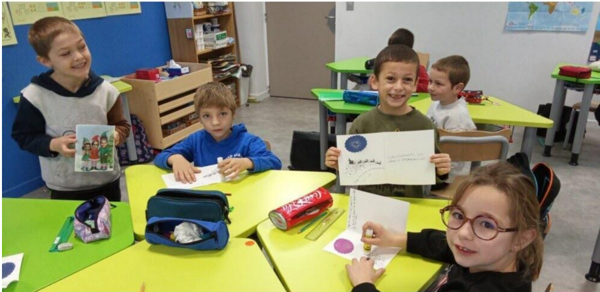
Les élèves de l'école Jeanne d'Arc en plein travail.

Lundi 15 décembre, le bilan de la première opération "cartes de vœux" s'est soldé par des retours positifs. Avant d'accrocher leurs cartables aux portemanteaux des vacances, les écoliers de Jeanne d'Arc s'étaient transformés en lutins du père Noël. Sur une proposition de l'équipe pédagogique, ils ont confectionné des cartes de vœux pour les tables du repas des têtes blanches organisé par la municipalité à la salle La Treille. Alors que les maternelles ont réalisé le découpage, les plus grands ont rédigé des souhaits de bonne année. Sur les cartes, le visage des lutins avait été remplacé par celui des enfants. Certains des quelque 310 invités au traditionnel repas de fin d'année ont ainsi pu reconnaître leurs petits-enfants.