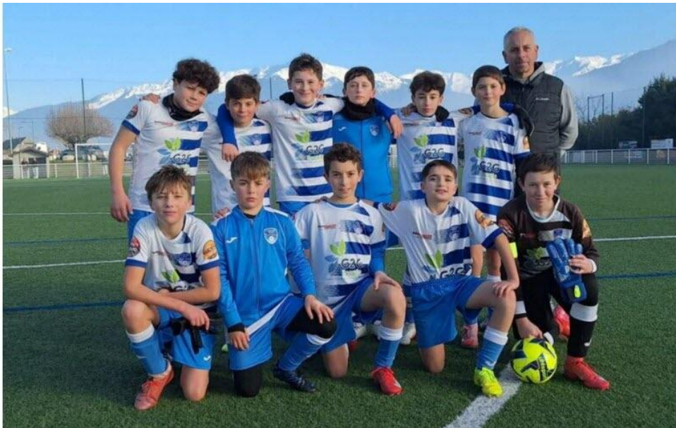
L'équipe des U13 se classe en deuxième position.

Ce samedi 13 décembre, l'équipe des U13 de Saint-Pierre sport football, recevaient, pour le second tour de la coupe de Savoie, deux clubs. Les Saint-Pierrains ont perdu 1 à 6 face à Chambéry SF, la marche étant trop haute. Ils ont su rebondir en gagnant 3 à 1 contre Chambéry sport 73. Le