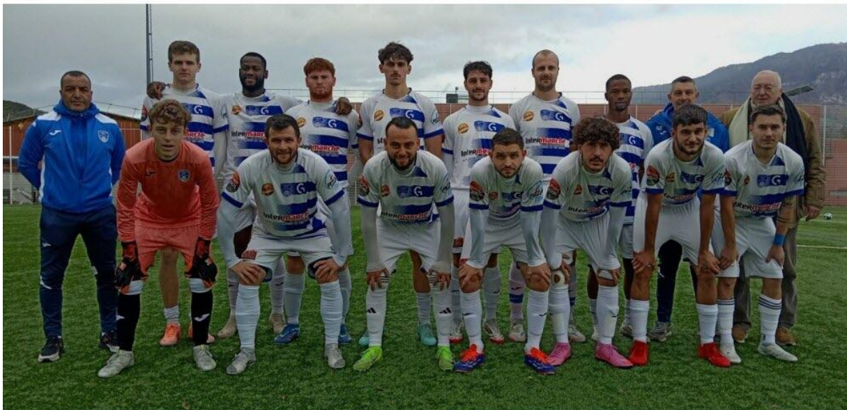
L'équipe fanion de Saint-Pierre Sport Football .

Pour le compte de la septième rencontre du championnat de D1 sur le terrain d'Aix-les-Bains, l'équipe fanion de Saint-Pierre sport football a pris un bon point, ce dimanche 26 octobre, suite à un match équilibré entre deux belles équipes. Après une très bonne entame, les Saint-pierrains sont menés 2 à 0. L'équipe a su reprendre l'ascendant sur cette deuxième mi-temps pour revenir au score grâce à deux buts de Chris Miombé.