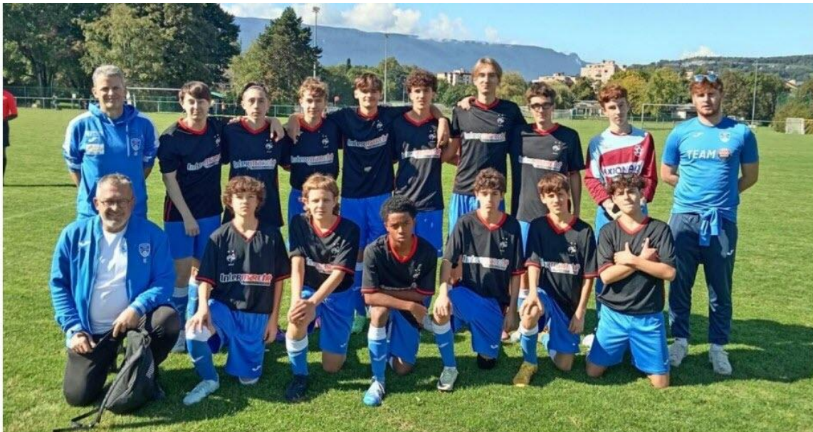
L'équipe U17 de D1 jouera contre le FC Chambotte.

Après sa victoire (9-4) lors de son troisième match de championnat à Barberaz la semaine dernière, l'équipe U17 de D1 de Saint-Pierre sports football recevra le FC Chambotte ce samedi 4 octobre à 15 heures.