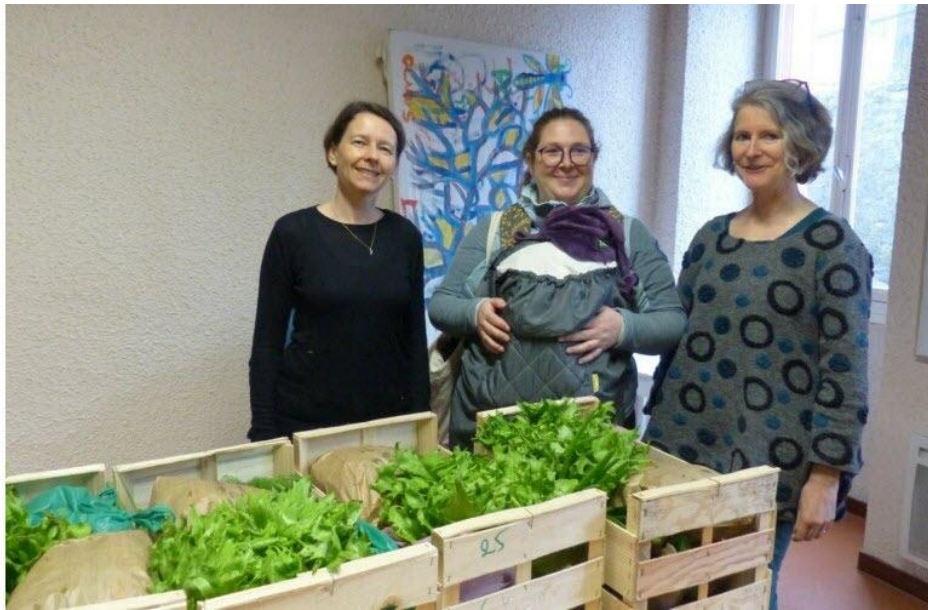
La Partageraie crée du lien social entre générations.