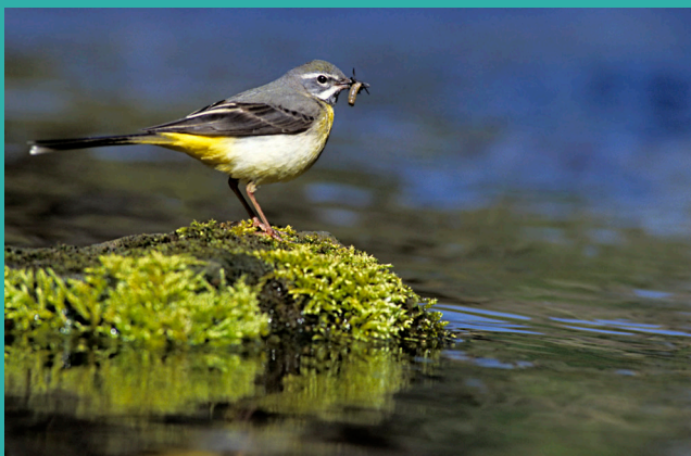
Bergeronnette des ruisseaux

De 2026 à 2028 Biviers s'est engagée dans la réalisation d'un Atlas de la Biodiversité Communale (ABC) en partenariat avec le Parc naturel régional de Chartreuse avec l'objectif de :