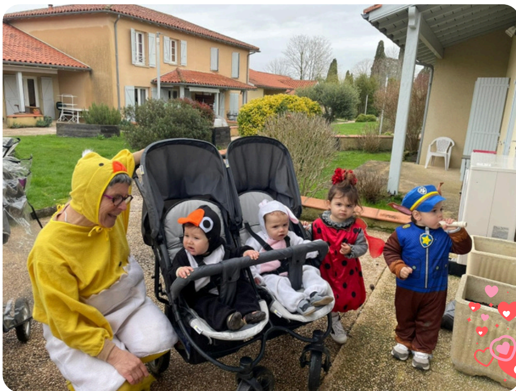
En voisin, "les petiots" ont eu leur carnaval !