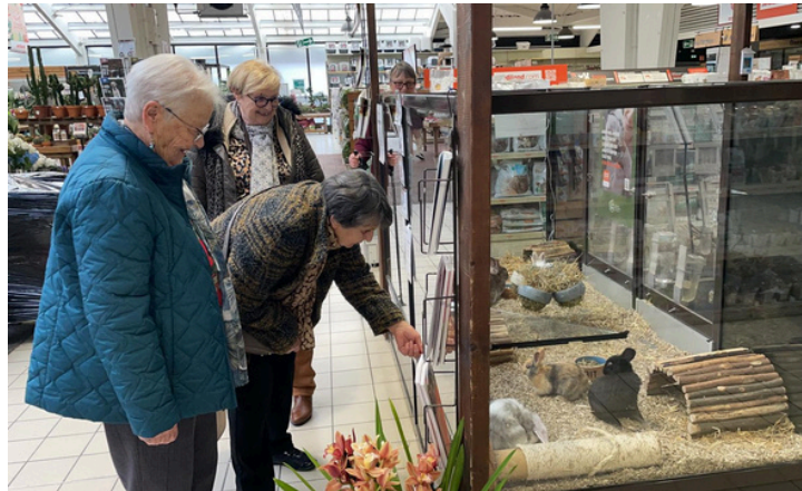
Le coin animalerie si attrayant !