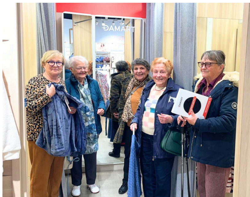
Et des achats coup de coeur !