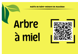
Exemple de panneau installé dans le verger communal

Vous avez sans doute remarqué qu'une tendre et délicate rose a été placée aux endroits stratégiques de même que l'éclairage de notre mairie pour « octobre rose », ceci pour témoigner de notre engagement.