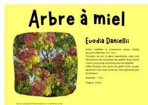
Texte affiché sur le site de la commune après scan du QR code

Après une météo caniculaire cet été, les plantations du verger n'ont pas souffert, grâce à l'entretien et l'arrosage régulier ; un grand merci au service technique. Afin que tous puissent connaître chaque espèce, nous avons préparé des panneaux dotés de QR code, qui permettront en direct et muni d'un téléphone, de connaître l'origine, la floraison, etc. Ces panneaux seront placés pour la fin d'année, préparation en cours.