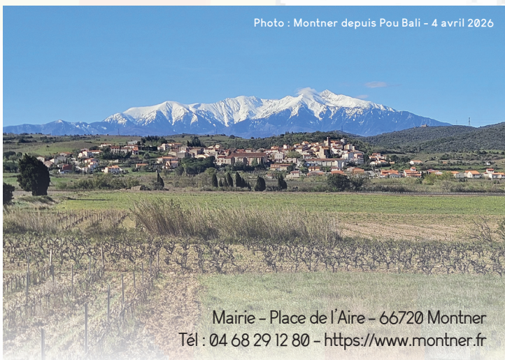
Photo : Montner depuis Pou Bali - 4 avril 2026

Mairie - Place de l'Aire - 66720 Montner Tél : 04 68 29 12 80 - https://www.montner.fr