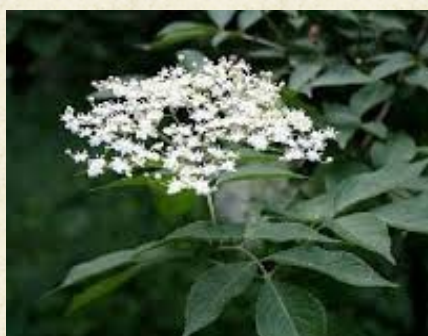
Inflorescence du sureau ou grand sureau ( Sambucus nigra )