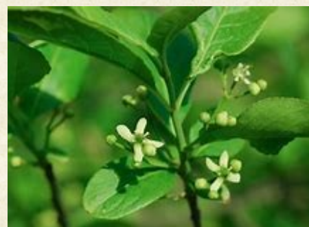
Fleurs de fusain ou bonnet de prêtre, ou bonnet d'évêque ( Euonymus europaeus )