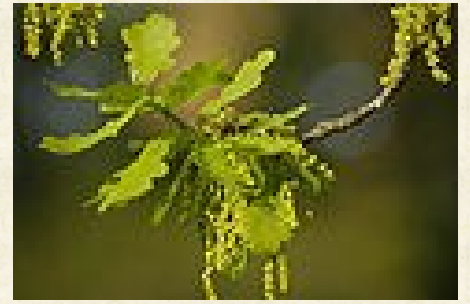
Châtons mâles de chêne ( Quercus )