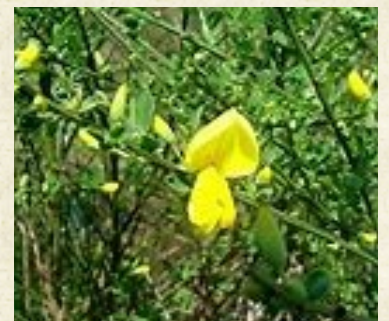
Fleurs de genêt à balais ( Cytisus scoparius )