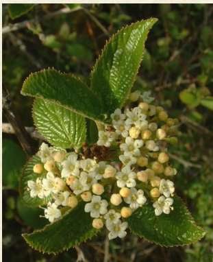
Fleurs de viorne lantane, lantane, viorne mancienne ou viorne flexible ( Viburnum lantana )