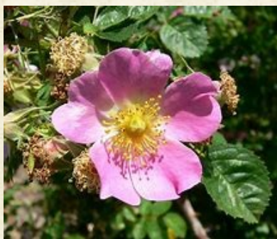
Fleur d'églantier, rosier des chiens ou rosier des haies ( Rosa canina )