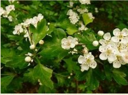
Aubépine à un style ( Crataegus monogyna )