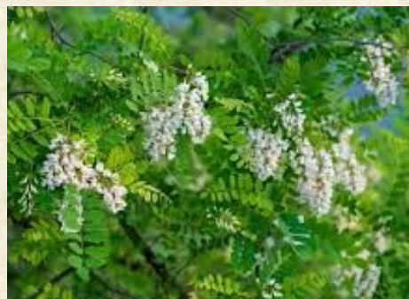
Fleurs de robinier faux acacia ou acacia ( Robinia pseudoacacia )