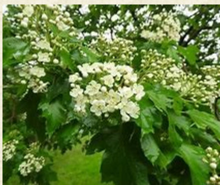
Fleurs d'Alisier terminal ou qlisier des bois ou Sorbier terminal ( Sorbus torminalis )