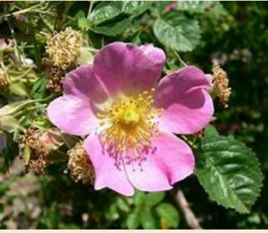
Fleur d'églantier, rosier des chiens ou rosier des haies ( Rosa canina )