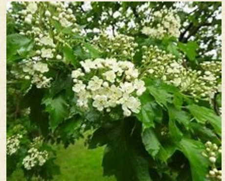
Fleurs d'Alisier terminal ou qlisier des bois ou Sorbier terminal ( Sorbus torminalis )