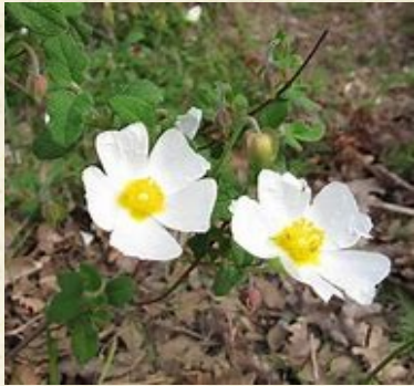
Fleurs de cistes de Montpellier ( Cistus monspeliensis )