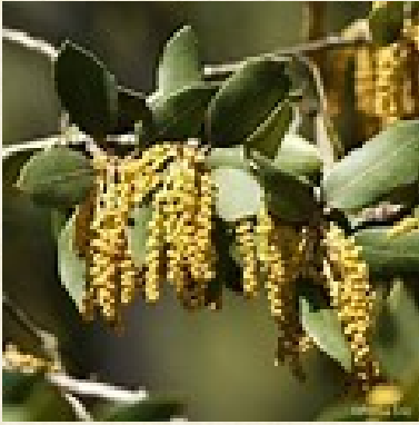
Fleur de chêne ou yeuse ( Quercus ilex )