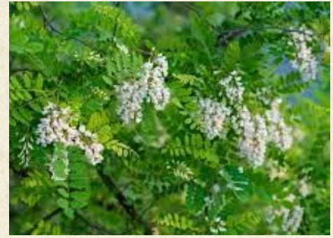
Fleurs de robinier faux acacia ou acacia ( Robinia pseudoacacia )