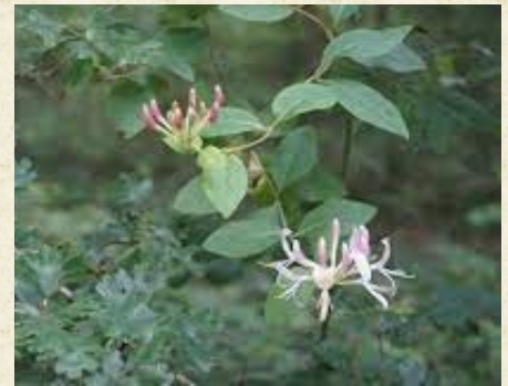
Fleurs de chèvrefeuille des bois ( Lonicera periclymenum )