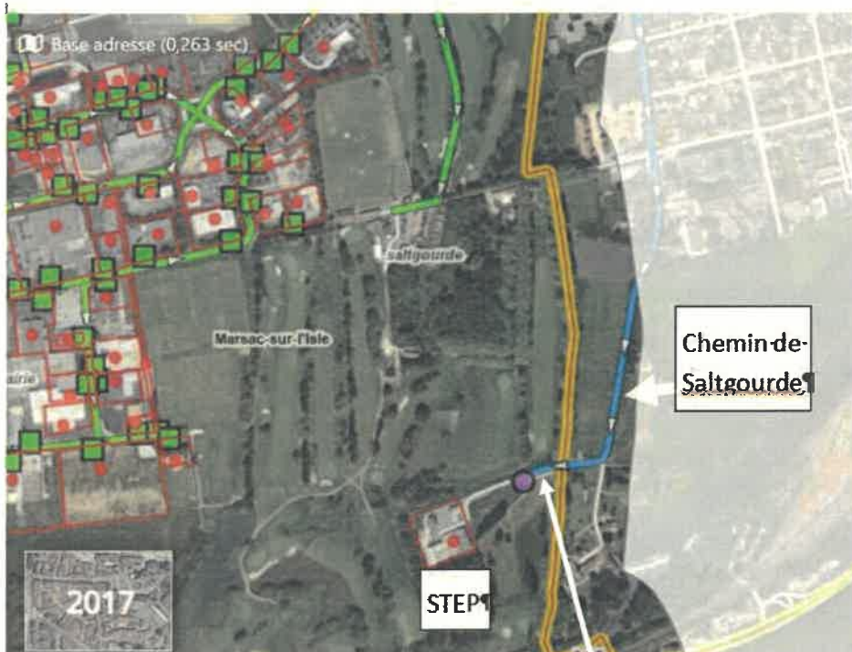
Chemin du grand pré

AUTORISER M. le Maire ou son représentant à signer toutes les pièces nécessaires à l'exécution de la présente délibération.