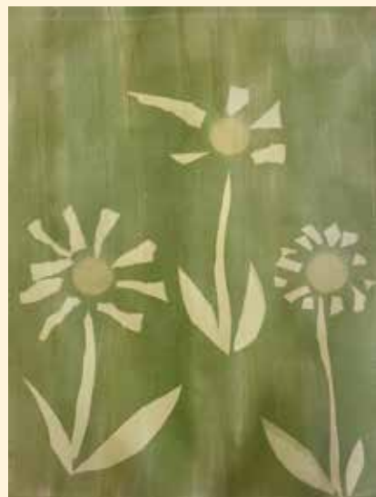
Réalisation de l'école d'E. D'Orves

L'exposition des œuvres des élèves du conservatoire est de retour et elle associera de nouveau les productions de tous nos élèves : cours périscolaires enfants et adultes et ateliers en milieu scolaire. Ils ont eu l'opportunité d'accéder à une grande variété de pratiques (dessin, peinture, modelage, sculpture, céramique, mosaïque...) et ont exploré de nombreuses thématiques (les animaux, le portrait, les saisons, les cabanes, la calligraphie, le monde d'Aladdin...).