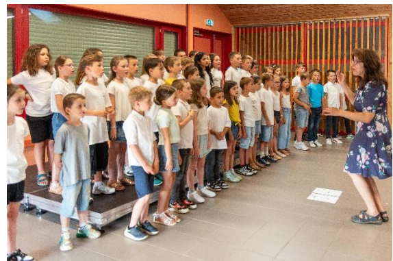
Spectacle du 12 06 2026