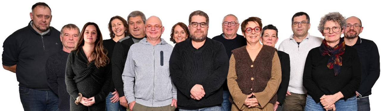
Les membres du conseil municipal, de gauche à droite sur la photo :