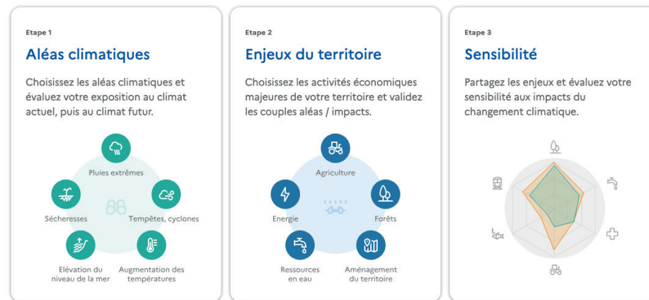
Illustrations démarche TAACT

Trajectoires d'Adaptation au Changement Climatique des Territoires