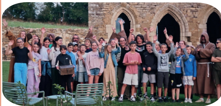
Escape game créée par l'équipe d'animation à l'abbaye de Trizay (Bournezeau) et proposée aux jeunes cet été dans le cadre Lay Z'itinérantes.

Lay z'itinérantes , service dédié aux jeunes de 11 à 14 ans, continue de proposer des activités à chaque période de vacances scolaires : cuisine, ateliers créatifs, jeux sportifs, sorties... Les bénévoles chapotant ce service proposent également tous les ans une Teen's party (soirée dansante réservée aux jeunes 11-15 ans) au mois d'octobre. L'édition 2025 a été une nouvelle fois une grande réussite avec la participation de plus d'une centaine de jeunes.