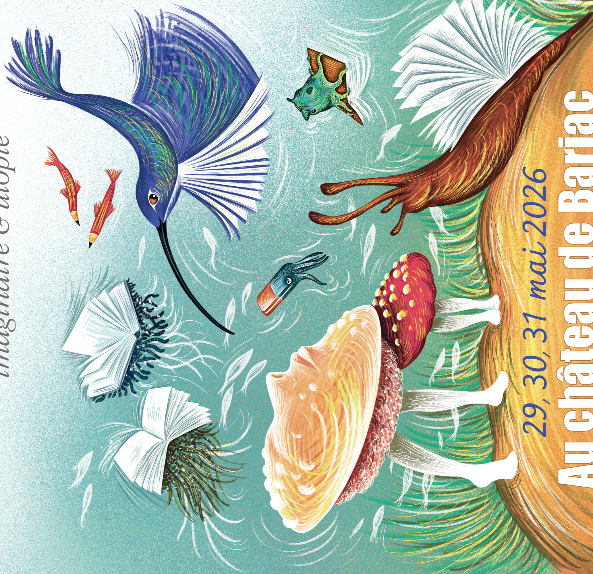
Illustration : Isabelle Simler