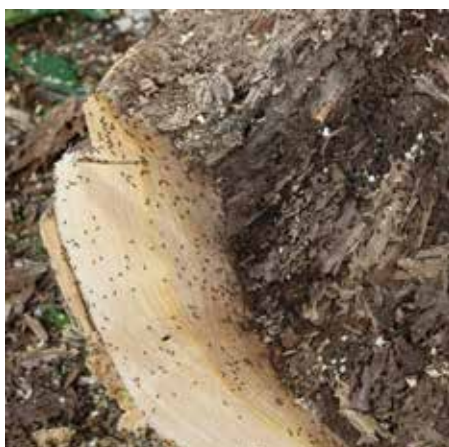
Des colonies de fourmis avaient pris place à l'intérieur des arbres en apparence en bonne santé.