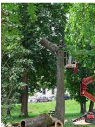
Cette intervention s'inscrit dans une démarche de gestion raisonnée du patrimoine arboré communal.