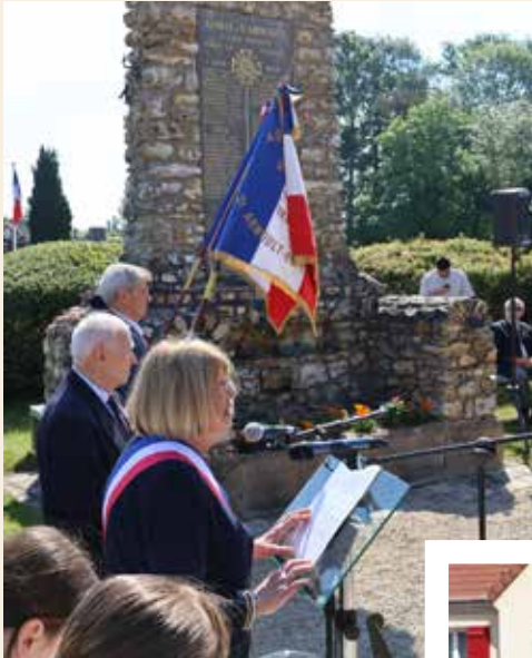
Madame le maire a lu le discours de la ministre des Armées Catherine Vautrin

Le 8 mai 2026, familles, forces de l'ordre, jeunes sapeurs-pompiers, élus, représentants des associations patriotiques et porte-drapeaux ont tenu à être présents pour un temps de recueillement en mémoire des victimes de la Seconde Guerre mondiale.