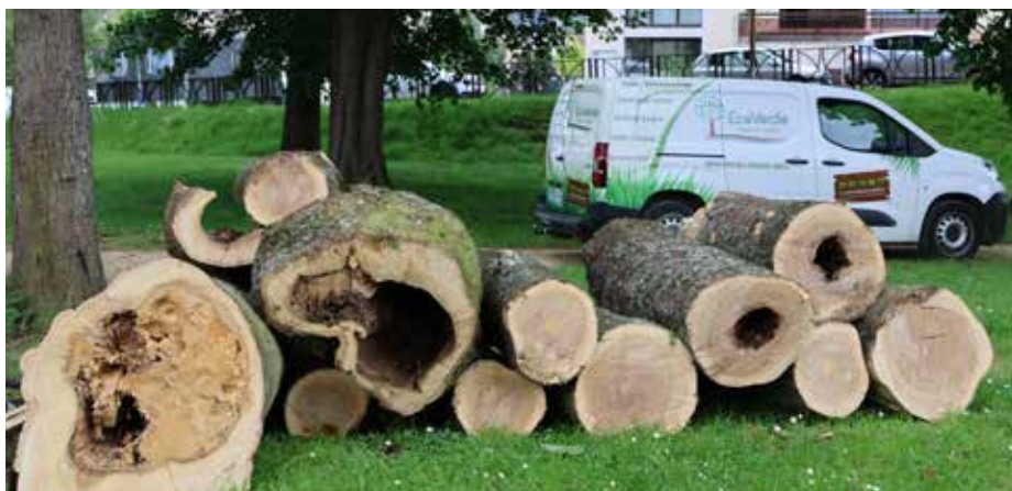
Preuves du bien-fondé de l'abattage de ces trois grands arbres.