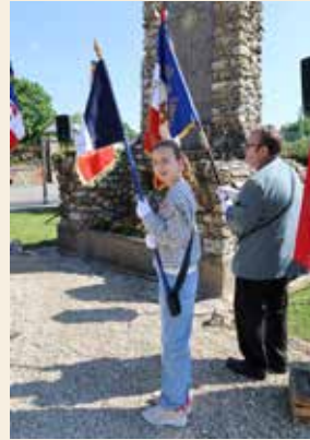
Le CMJ dispose de son propre drapeau

Le 8 mai 2026, familles, forces de l'ordre, jeunes sapeurs-pompiers, élus, représentants des associations patriotiques et porte-drapeaux ont tenu à être présents pour un temps de recueillement en mémoire des victimes de la Seconde Guerre mondiale.