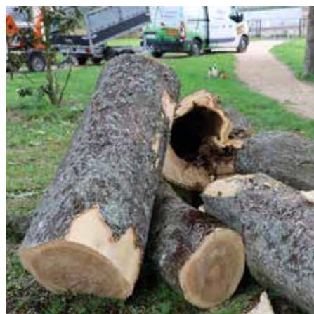
Le mal était bien caché. Chaque arbre d'apparence saine sonnait creux en partie.