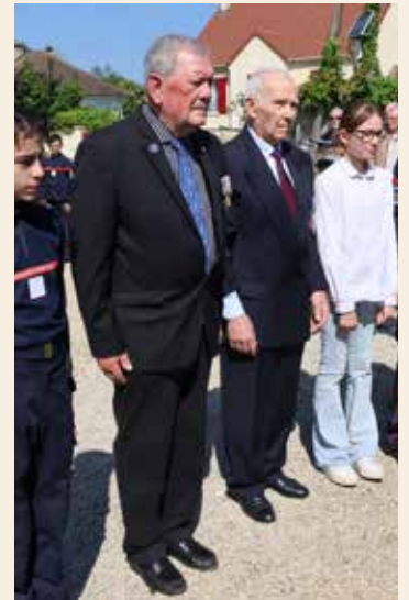
Les représentants des associations patriotiques