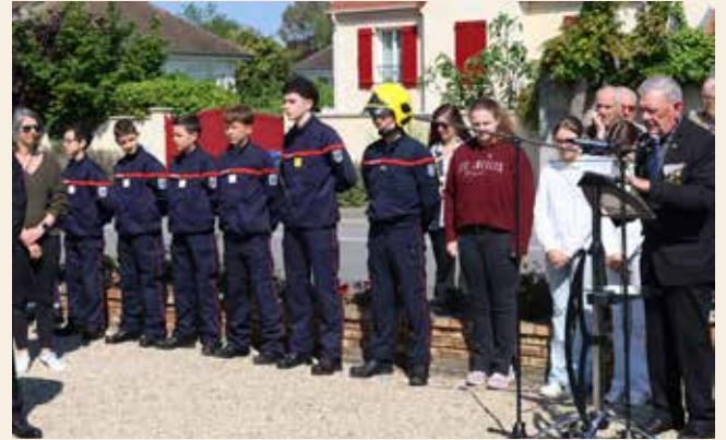
Une commémoration intergénérationnelle