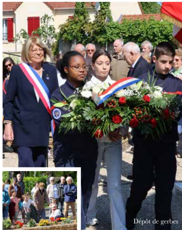
Dépôt de gerbes