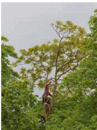
La société arnolphiennne Eco Verde en action à plus de 20 mètres de hauteur.

Après la chute d'un arbre au parc Arsonneau le 25 mars, la commune a engagé un diagnostic sanitaire approfondi. L'expertise a révélé des fragilités internes sur deux marronniers et un platane, abattus du 18 au 20 mai pour garantir la sécurité du public.