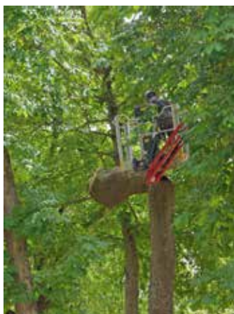
Après les branches, le fût de chaque arbre a été débité, tronçon par tronçon.