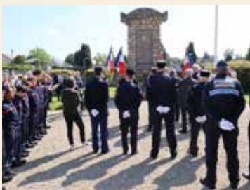
Présence des forces de l'ordre et de secours