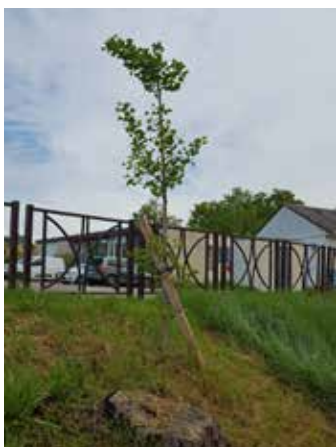
Comme pour les arbres précédemment abattus, de nouveaux seront plantés en lieu et place.