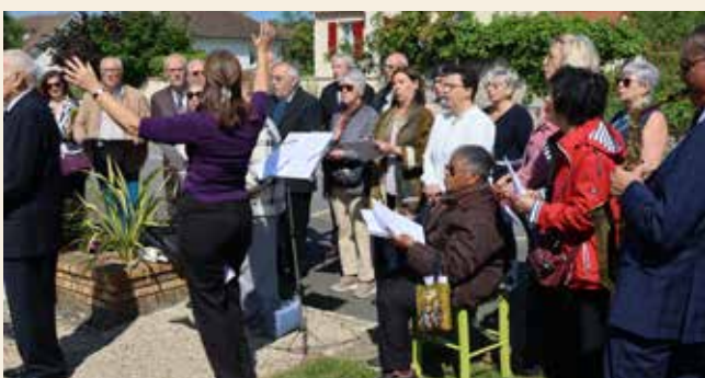
La chorale a entonné le chant des Partisans et la Marseillaise