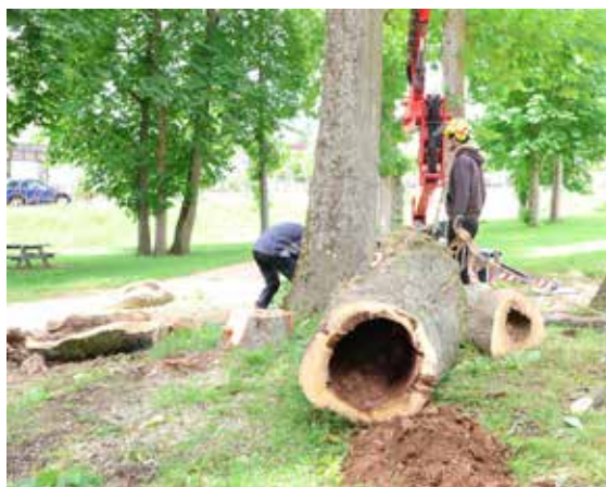
Le constat est sans appel. Ces arbres étaient susceptibles un jour de céder au vent.