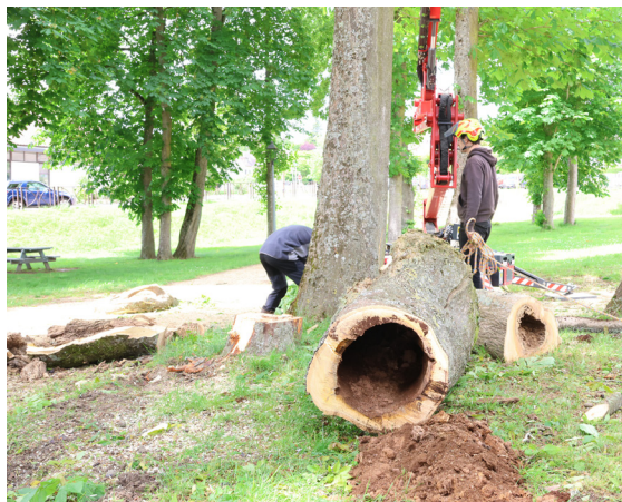
Le constat est sans appel. Ces arbres étaient susceptibles un jour de céder au vent.