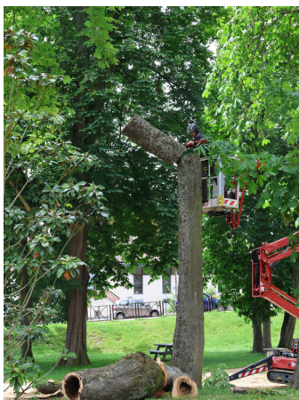
Cette intervention s'inscrit dans une démarche de gestion raisonnée du patrimoine arboré communal.