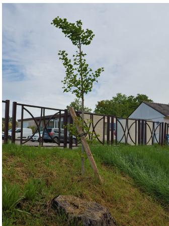
Comme pour les arbres précédemment abattus, de nouveaux seront plantés en lieu et place.