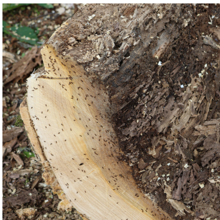
Des colonies de fourmis avaient pris place à l'intérieur des arbres en apparence en bonne santé.