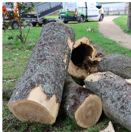
Le mal était bien caché. Chaque arbre d'apparence saine sonnait creux en partie.