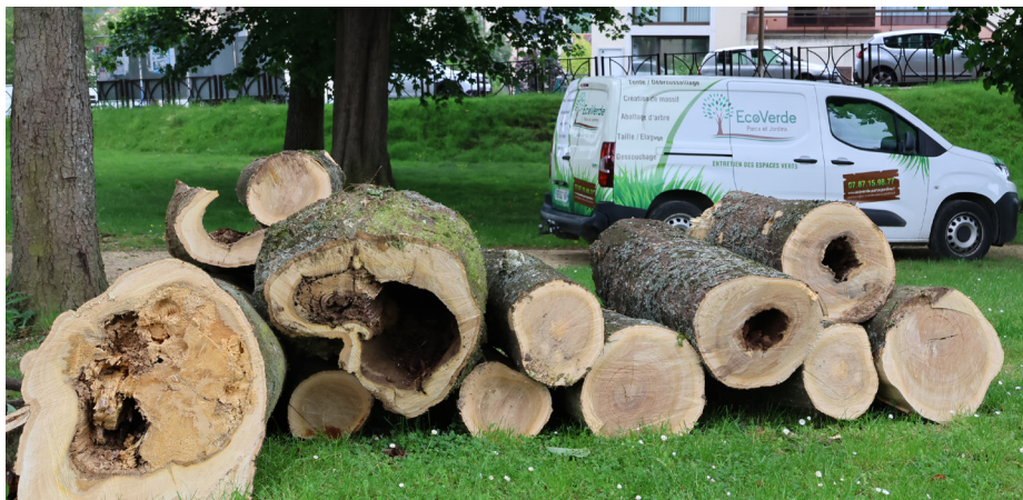
Preuves du bien-fondé de l'abattage de ces trois grands arbres.