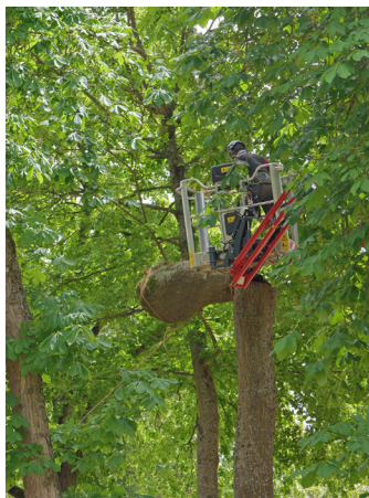
Après les branches, le fût de chaque arbre a été débité, tronçon par tronçon.