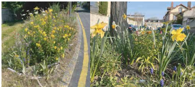
Exemple de fleurissement réalisé par les riverains place Charolais et place Joyale.

Et si vous plantiez un arbre à l'occasion d'une naissance ? De nombreux espaces dans la commune peuvent accueillir ce beau projet.