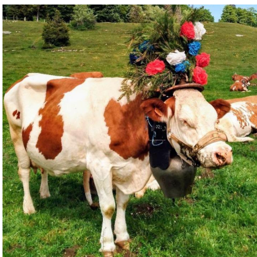
Transhumance musicale