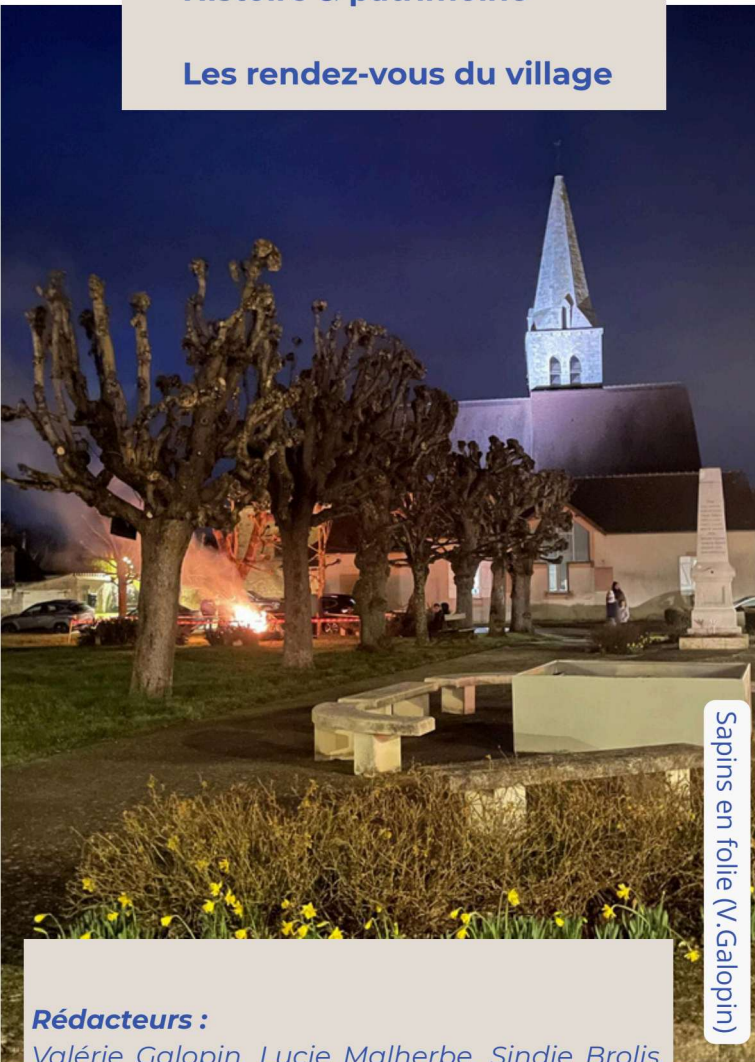
Sapins en folie