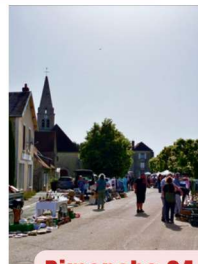
Dimanche 24 Mai Brocante (SELS)