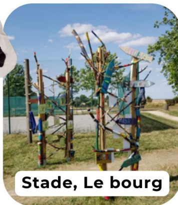
Stade, Le bourg