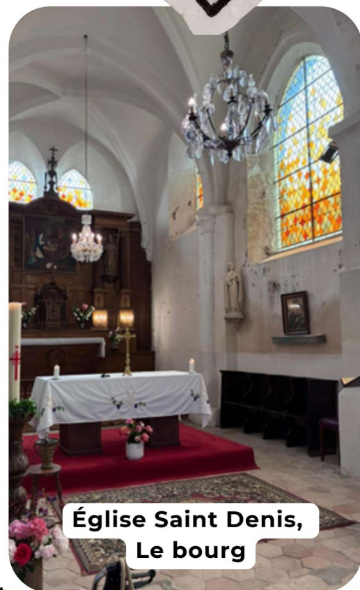
Église Saint Denis, Le bourg

Mise en place de totems au verger pédagogique avec les enfants de l'école