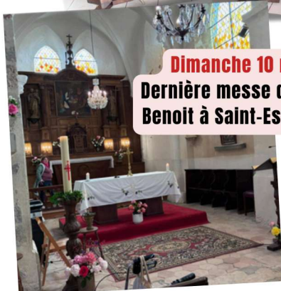
Dimanche 10 mai Dernière messe du père Benoit à Saint-Escobille