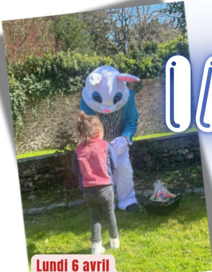
Lundi 6 avril Chasse aux oeufs (SELS)