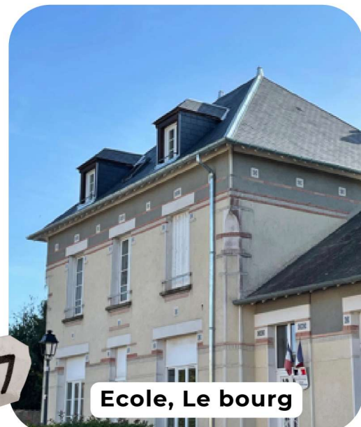
Ecole, Le bourg