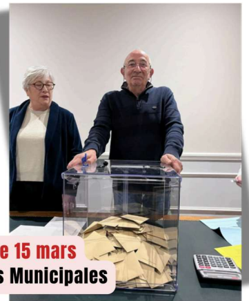
Dimanche 15 mars Elections Municipales