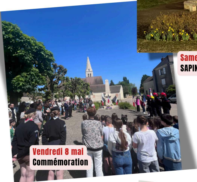
Vendredi 8 mai Commémoration