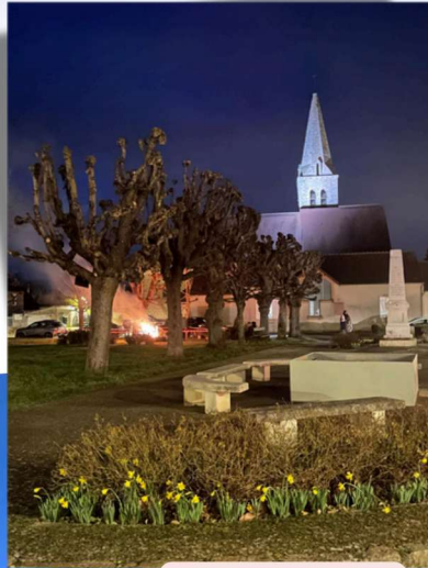
Samedi 17 janvier SAPINS en FOLIE (SELS)