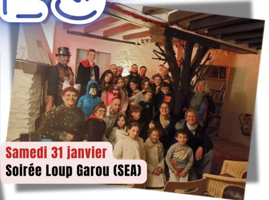
Samedi 31 janvier Soirée Loup Garou (SEA)