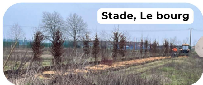
Stade, Le bourg