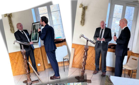
Samedi 24 janvier Voeux du Maire