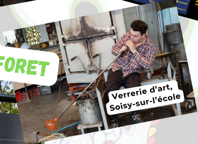
Verrerie d'art, Soisy-sur-l'école

Le 16 avril, les élèves de CP et CE1 de l'école École Niki de Saint Phalle de Saint-Escobille ont participé à une belle sortie scolaire avec tout d'abord la visite d'une verrerie d'art à Soisy-sur-École puis la découverte de l'œuvre de Jean Tinguely « Le Cyclop » dans la forêt de Milly-la-Forêt. Une journée riche en découvertes et très réussie.