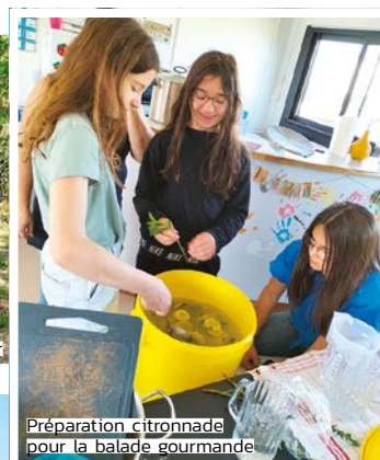
Préparation citronnade pour la balade gourmande