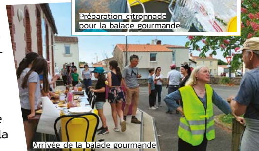
Arrivée de la balade gourmande