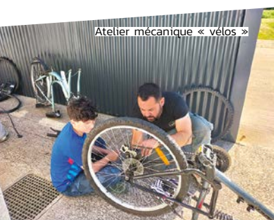
Atelier mécanique « vélos »

Quarante-deux randonneurs ont répondu présents et ont pu profiter d'un parcours convivial ponctué de dégustations : crêpes, caramel au beurre salé maison, citronnade, ainsi que des produits proposés par des producteurs locaux.