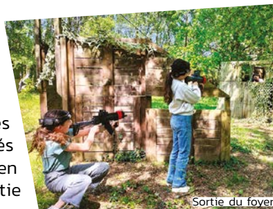
Sortie du foyer

Les jeunes inscrits au séjour d'été, prévu à Monterblanc près de Vannes du 6 au 10 juillet, se sont fortement mobilisés dans la préparation de la balade gourmande organisée en avril. Cette action avait pour objectif de financer une partie du voyage.