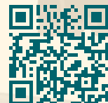
PLANCHE APÉRO SUR RÉSERVATION VIA NOTRE SITE : LEBRINVINSLIBRES.FR

Plus d'infos : amapdivatte@gmail.com ou via ce QR code >