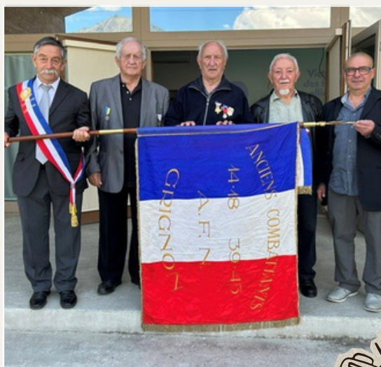
VIE LOCALE - Temps fort Commémoration 8 mai 1945