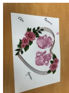
Le cadeau de la fête des mères