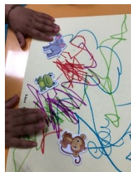
Mon esprit créatif