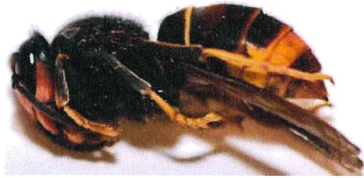
Gyne FA en dormance pendant la phase hivernale