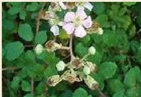
Fleurs de ronces communes, ronces des bois, ronces des haies ( Rubus fruticosus )