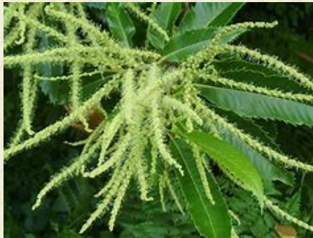
Chatons de châtaignier ( Castanea sativa )