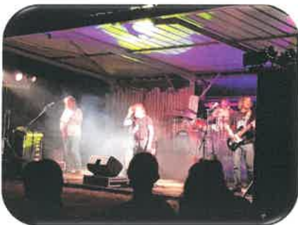
Concert des Binuchards