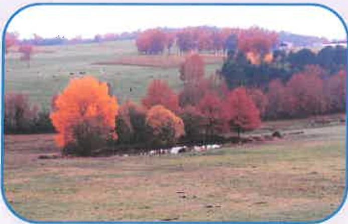
Entre Tournier et Touret