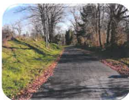
Le Bourg vers La Maurine

A noter : certaines portions seront reprises en garantie l'année prochaine suite à des défauts d'accroche des gravillons.