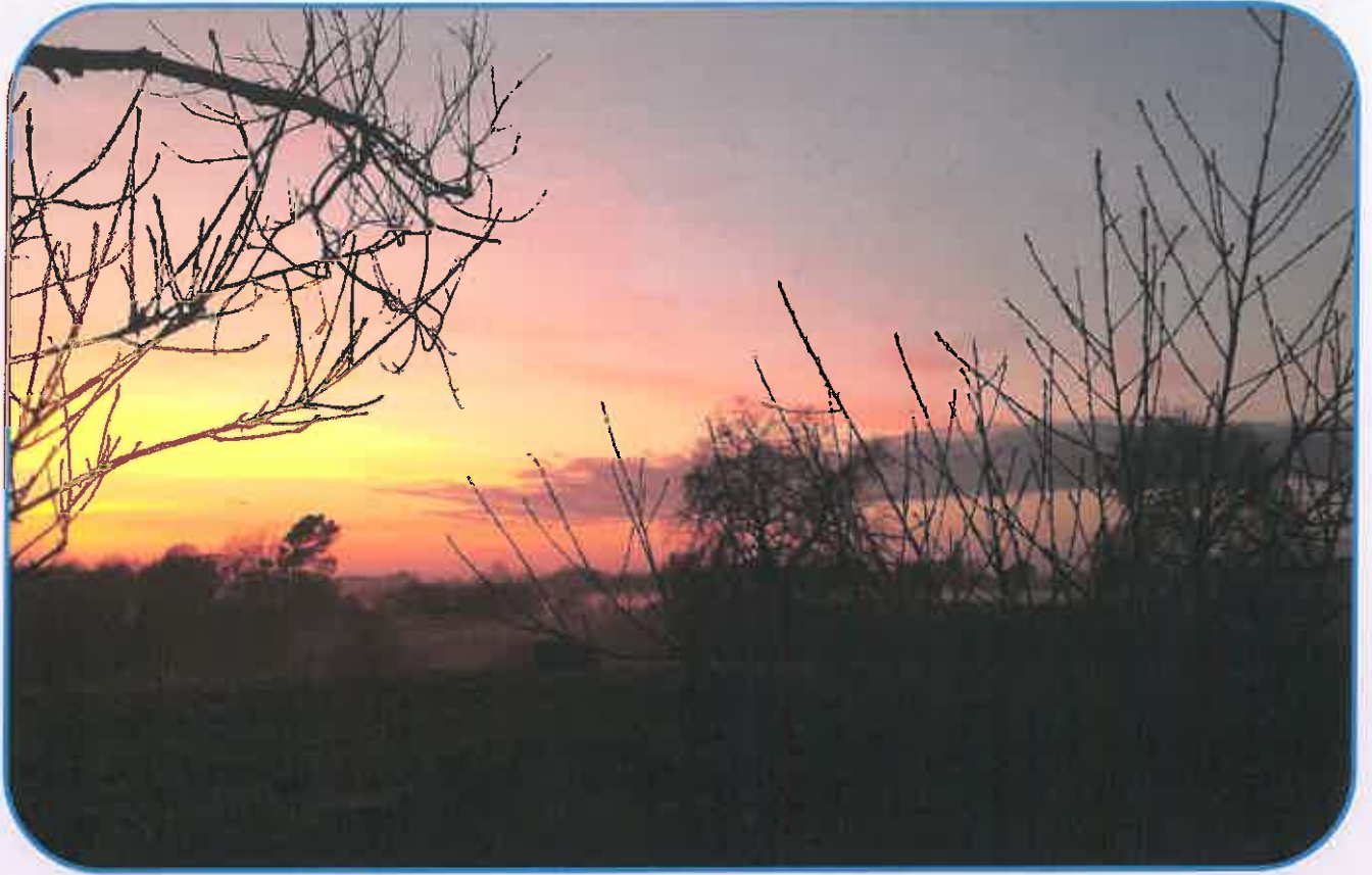
Coucher de soleil devant la Mairie