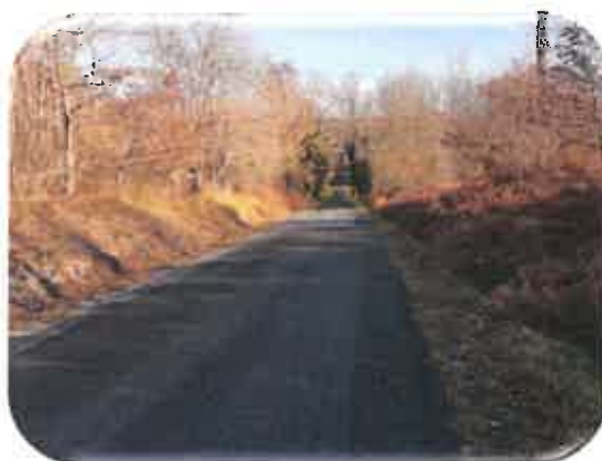
Entre Cressac et La Croix de Chiron