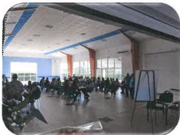
Concours de belote

Bravo et merci à tous ceux et celles qui se sont investis pour la réussite de cet évènement et... à l'année prochaine !