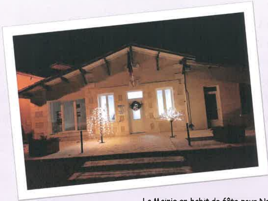
La Mairie en habit de fête pour Noël