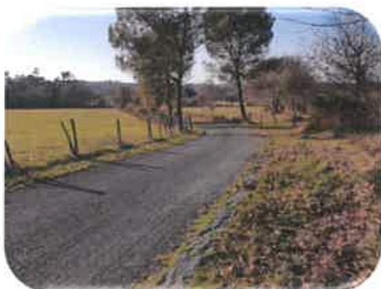
Canton des Merles vers Soubreville