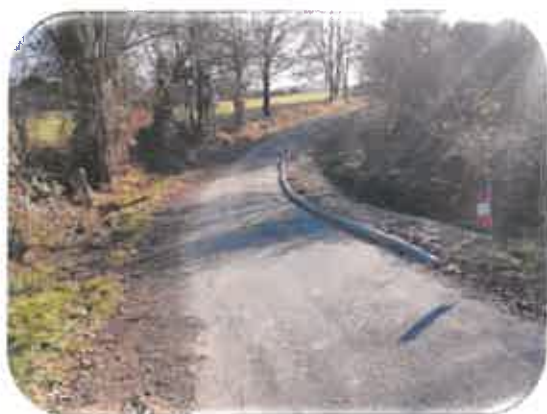
Bordure entre Pateau et Soubreville