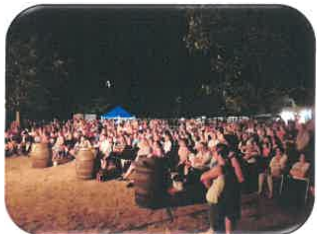
Public au concert des Binuchards