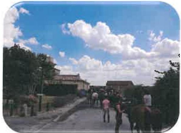
Randonnée équestre et pédestre