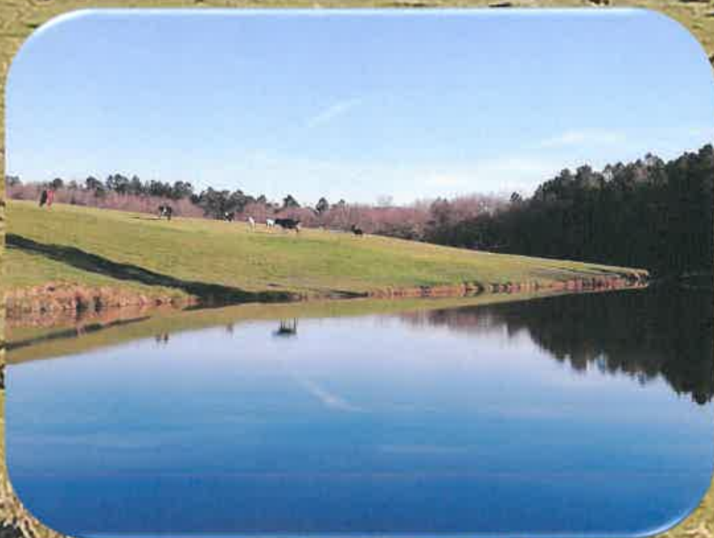
L'étang à Micheleau... côté face... ↗