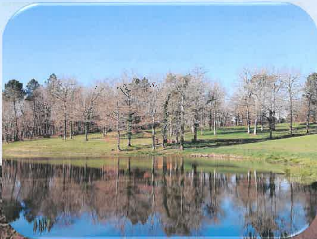
↘ L'étang à Micheleau... côté pile...