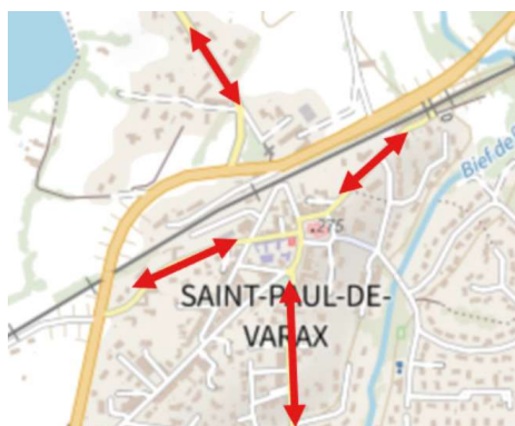
4 axes modes doux ont été étudiés

Avec un montant global de 768 192€ HT, la commune a engagé des travaux d'aménagements de modes doux afin d'améliorer le cadre de vie de ses habitants.