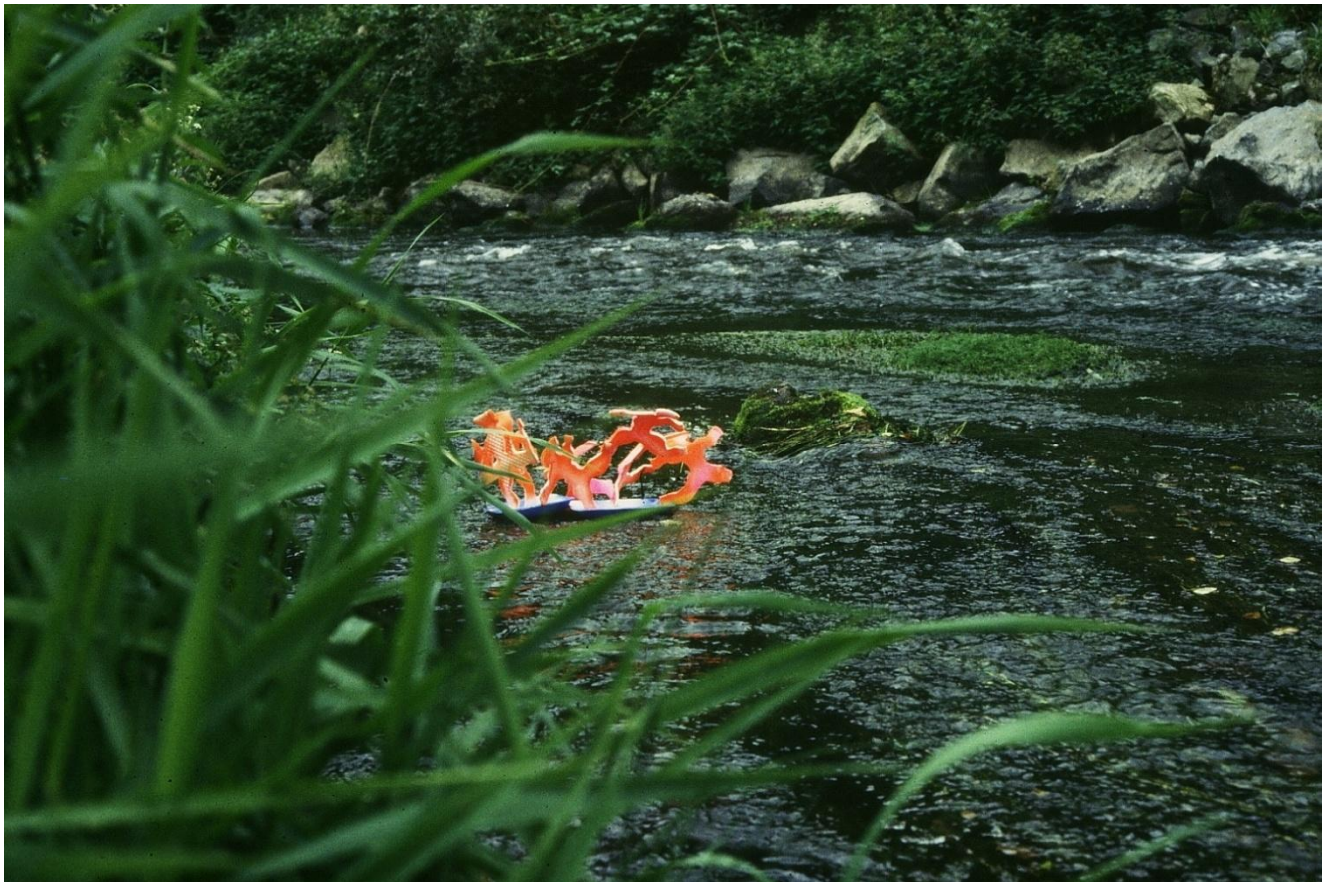
3- L'embarquement pour Cythère , 1985 © Denis Bulot – Adagp