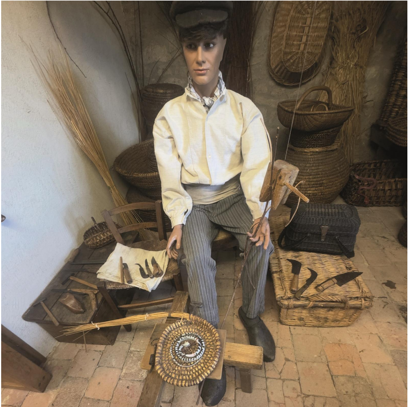
10- Lapalissyades au musée © Denis Bulot - Adagp