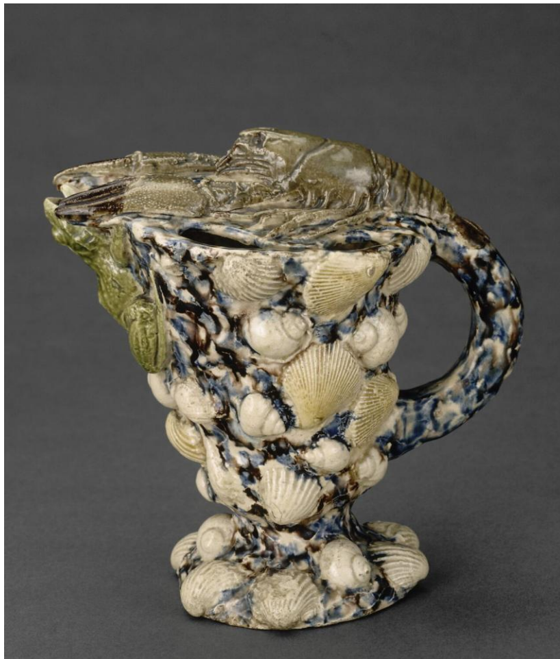
7- Pichet trompeur, Bernard Palissy, 1550-1560, musée du Louvre, département des objets d'art