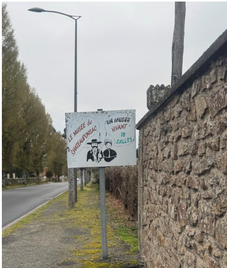
8- Panneau d'entrée de ville

Denis Bulot découvre le musée René Baubérot de Châteauponsac grâce à l'ancien panneau peint, à l'entrée de la ville, devant le cimetière qui annonce « un musée vivant » !