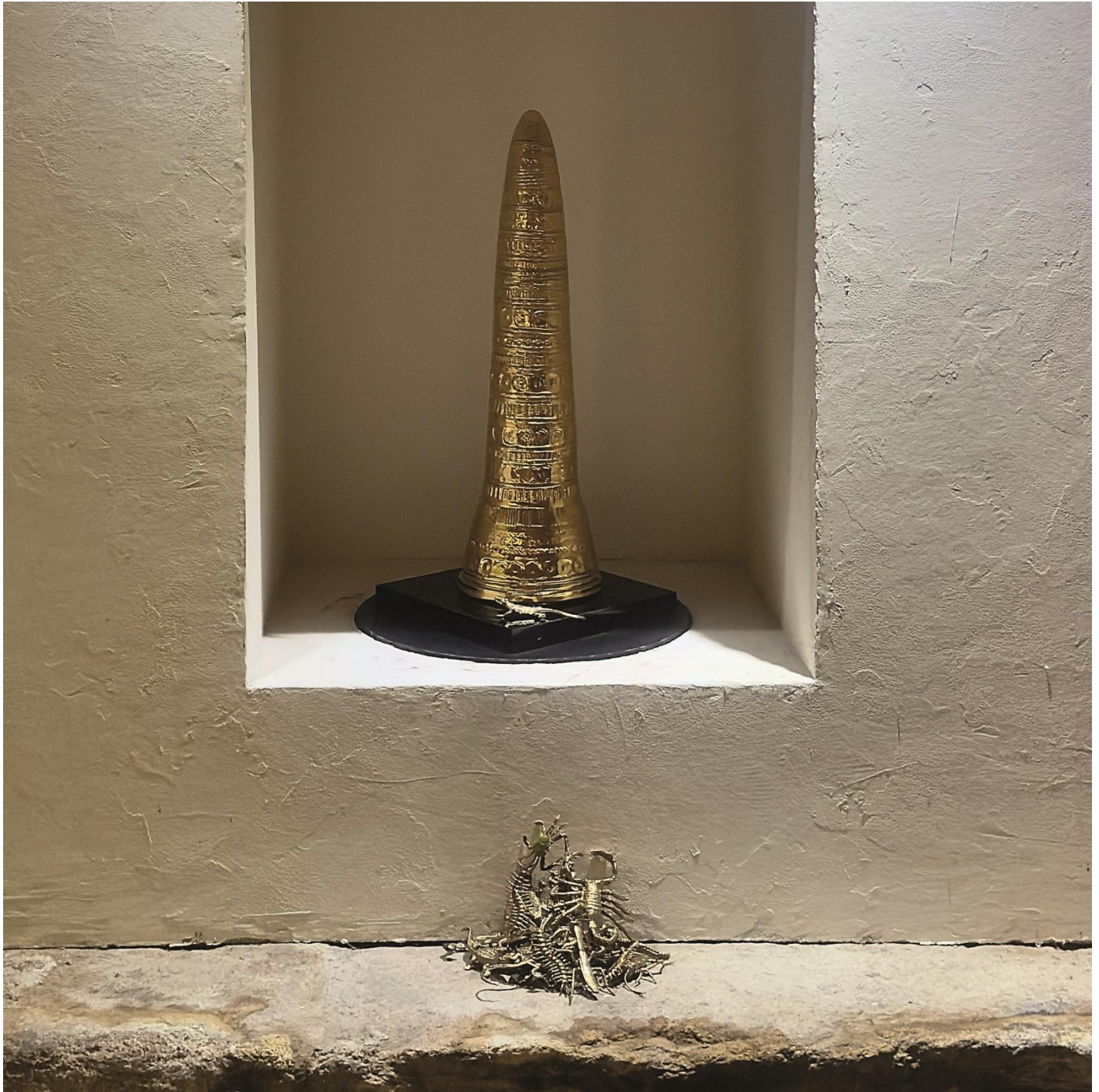
14- Lapalissyades au musée © Denis Bulot - Adagp