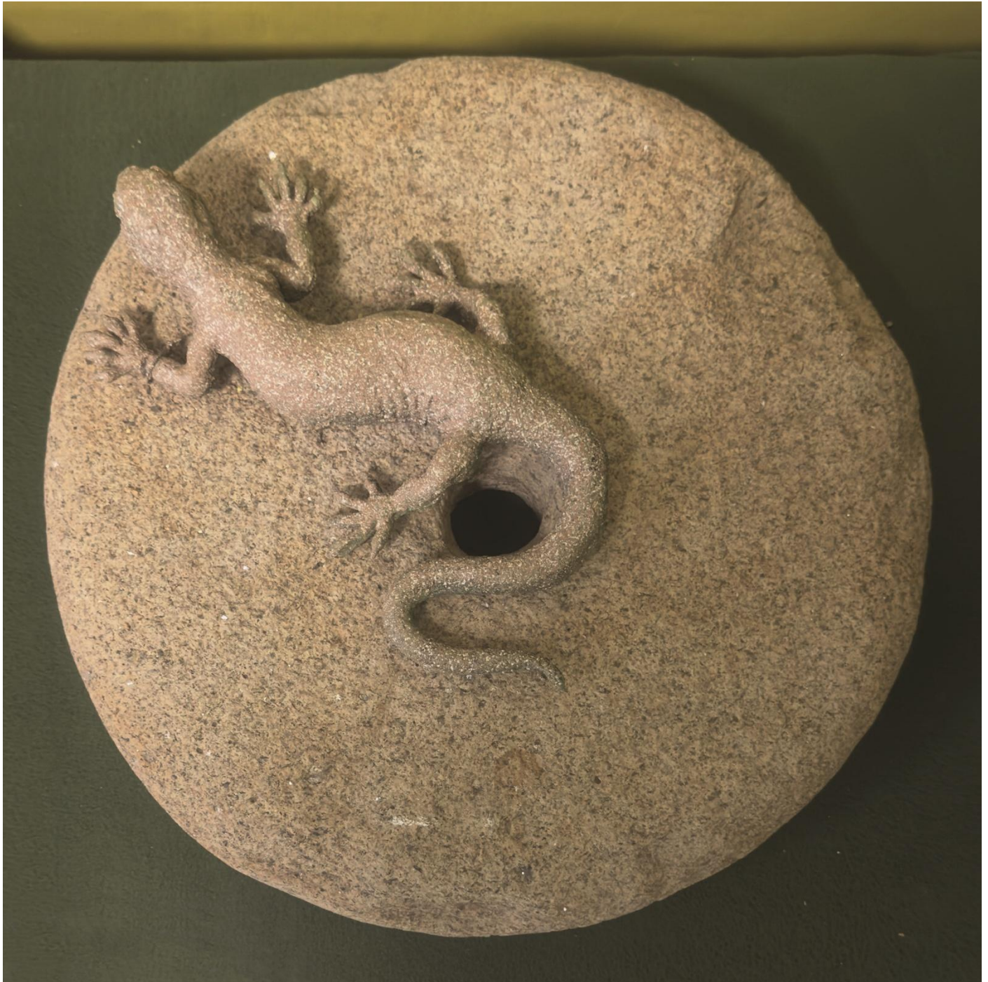
12- Lapalissyades au musée © Denis Bulot - Adagp