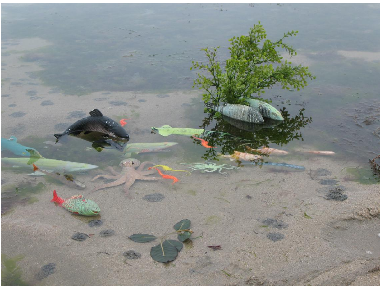
1- Aquarium, 2009 © Denis Bulot - Adagp

Après avoir mené une recherche picturale et sculpturale d'inspiration végétale à dominante fluorescente (1975-1982), Denis Bulot s'oriente, dès 1982, vers les installations sauvages en milieux naturels. Ces événements-performances sont un dialogue avec la nature et le paysage , un voyage ludique sur l'eau, dans le ciel, sur terre, à l'écoute du temps qui vient.