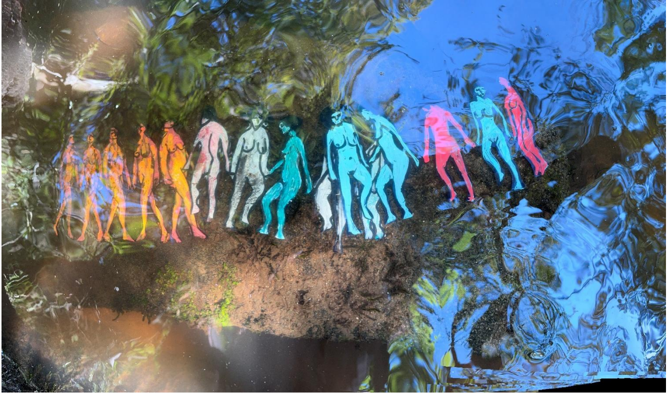
2- Baigneuses , 2025 © Denis Bulot - Adagp