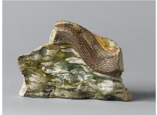
5- Fragment d'une grotte : coquillages, Bernard Palissy, musée Adrien Dubouché