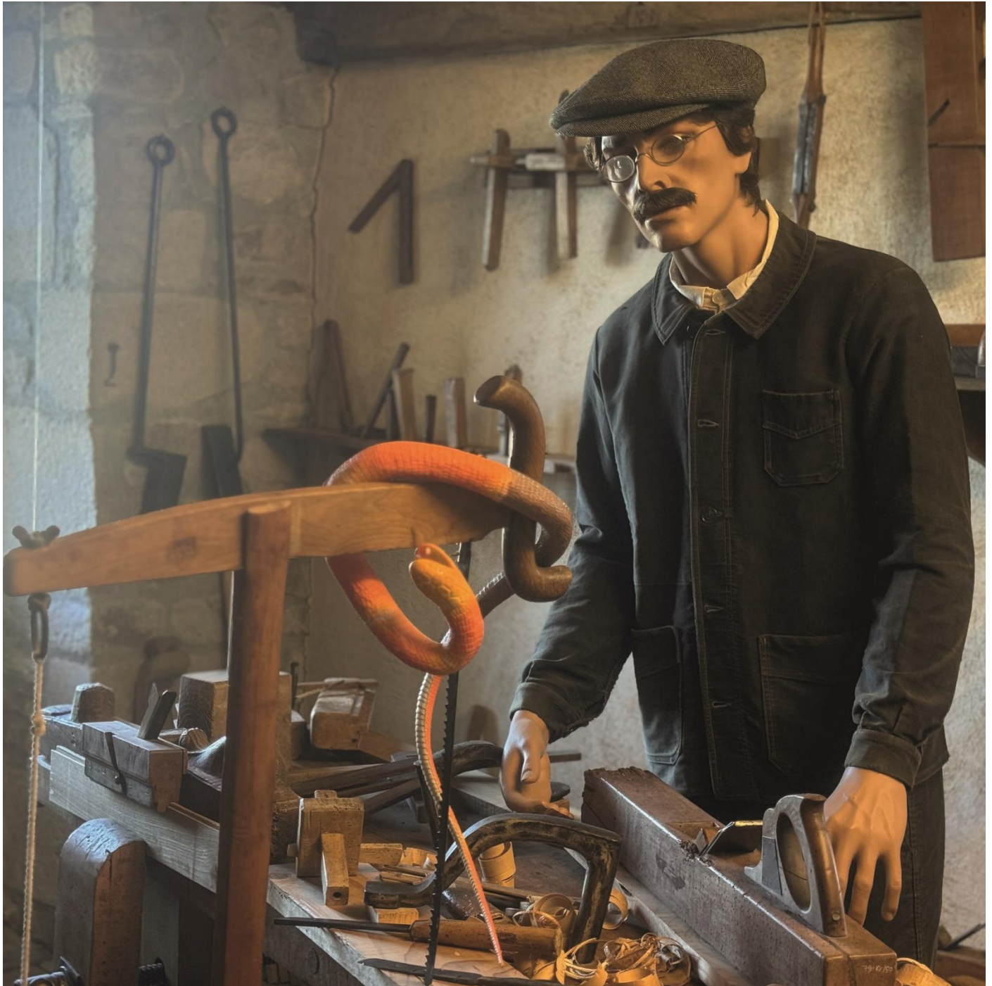
11- Lapalissyades au musée © Denis Bulot - Adagp