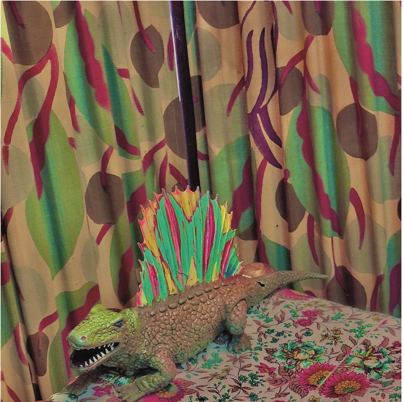
13- Lapalissyades au musée © Denis Bulot - Adagp