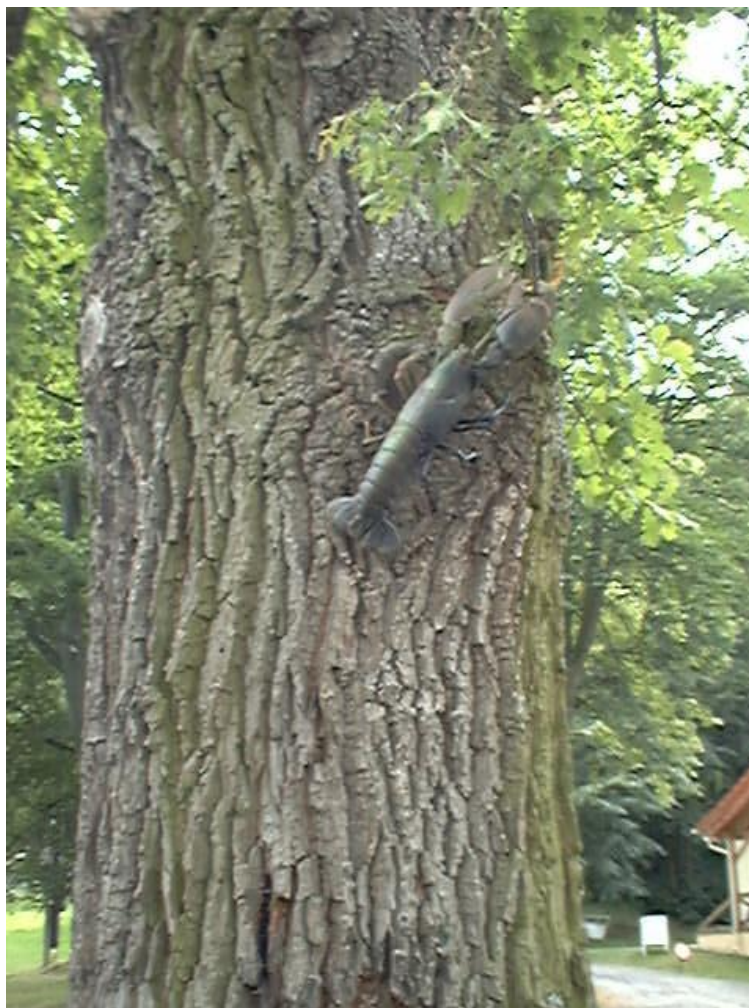
4- Homard à Klatovy, 2000 © Denis Bulot - Adagp

Cette série de créations-installations de Denis Bulot pourrait être simplement illustrée par « son homard » grim pant à un arbre. Initiées dès 2000, les Lapalissyades rendent hommage à Bernard Palissy et à Jacques de Chabannes de La Palice.