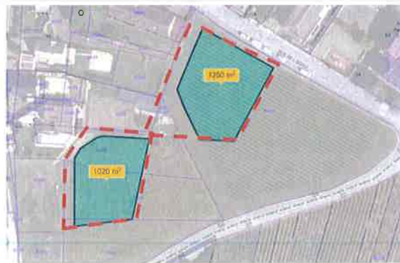
Secteur Nord Est (0,23 ha)

Les deux extensions sont dans la continuité de la zone urbaine et peuvent s'apparenter à de pseudo dents creuses. Néanmoins, au regard de la carte ci-dessus, nous nous interrogeons sur la nécessité de maintenir en zone U ces deux secteurs. Elles contribuent à une consommation de foncier viticole sur 0.40 ha. Cette consommation est d'autant plus impactant qu'elle coupe des rangs de vignes ce qui rend difficilement exploitable pour les vignerons les surfaces viticoles restantes.