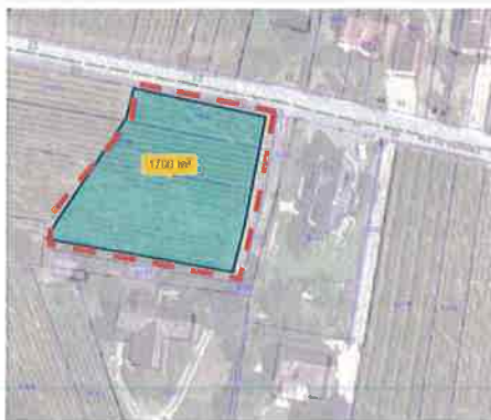
Secteur Ouest (0,17 ha)