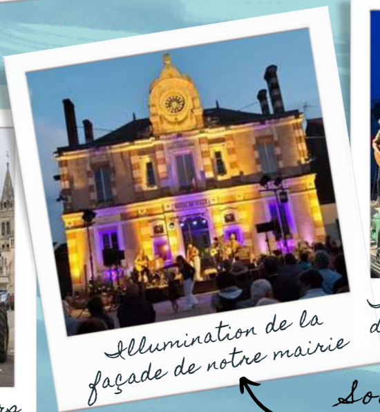
Illumination de la façade de notre mairie