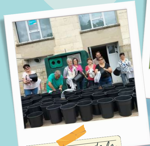
Le lendemain de la fête communale, c'est vaisselle XXL!