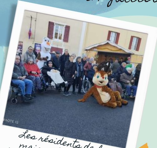
Les résidents de la maison de retraite ont rencontré les mascottes.