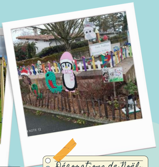
Décorations de Noël par les enfants de l'accueil périscolaire