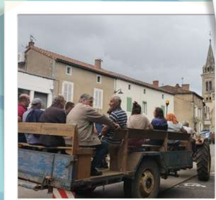
Défilé de vieux tracteurs et promenade en remorque