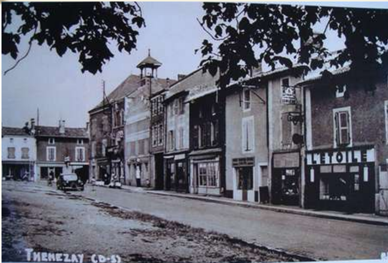
DEBUT DU XX ÈME SIÈCLE

Une chanson a même été écrite. Ici seulement 4 couplets sur les 16 que comprend cette composition, fait l'éloge de cette riche activité dont les façades remarquables donnaient une belle allure à notre bourg.