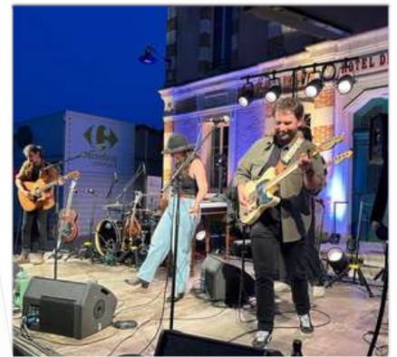
The Amber Day s'est produit devant près de 400 personnes