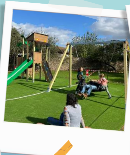
Mise en service de l'aire de jeux à côté du City stade