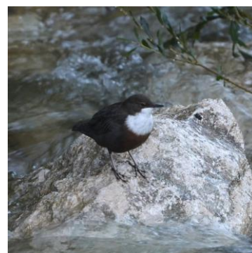
Cinglé plongeur

La Valserine bénéficie d'un suivi renforcé de la qualité de l'eau et des milieux aquatiques. En complément des réseaux réglementaires, plusieurs suivis permettent d'observer l'évolution de la rivière, d'identifier les pressions émergentes et d'orienter les futures actions de gestion. Ces données confirment aujourd'hui le bon état général de la Valserine.