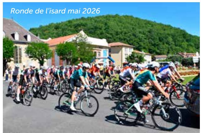
Ronde de l'isard mai 2026