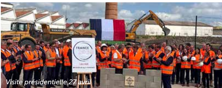
Visite présidentielle 27 avril