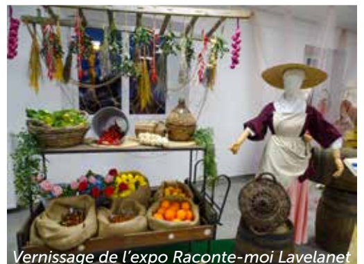
Vernissage de l'expo Raconte-moi Lavelanet