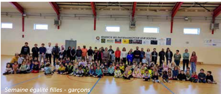
Semaine égalité filles - garçons