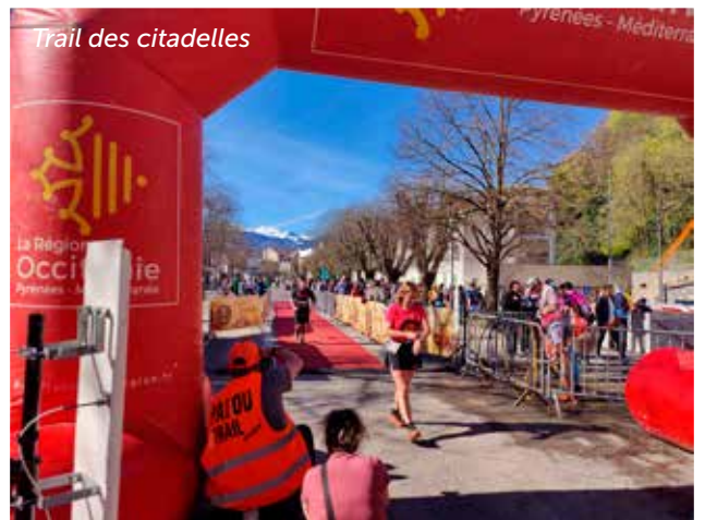
Trail des citadelles