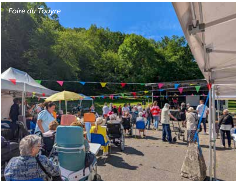
Foire du Touyre