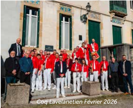
Coq Lavelanetien Février 2026