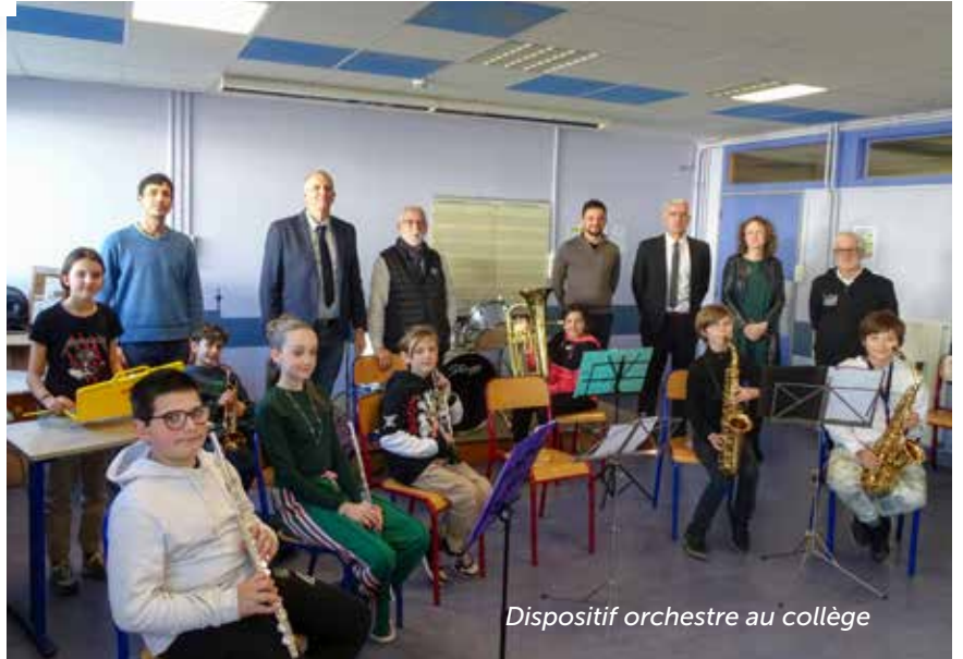
Dispositif orchestre au collège