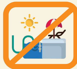
Remplissage et vidange des piscines privées**