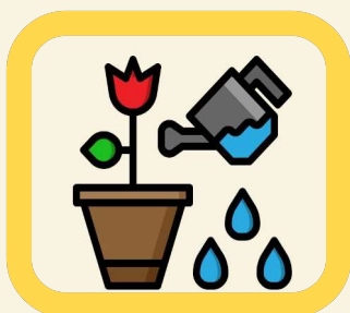
Arrosage des fleurs et massifs fleuris