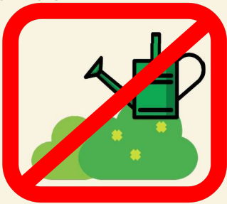
Arrosage des espaces verts ***