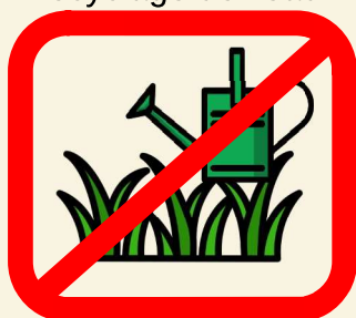
Arrosage des pelouses