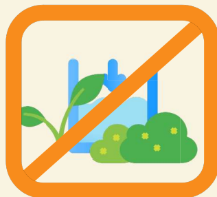
Alimentation des plans d'eau et biefs sauf hydroélectricité *