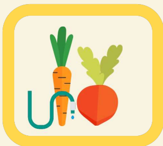
Arrosage des jardins potagers