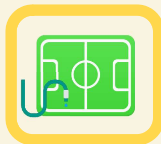
Arrosage des terrains de compétition engazonnés