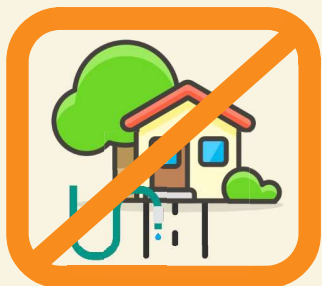
Nettoyage des façades, toitures, trottoirs sauf collectivité ou professionnels