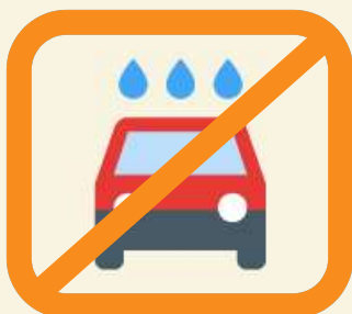
Sauf en station pour les lavages via lances à haute-pression et les portiques équipés de recyclage de l'eau