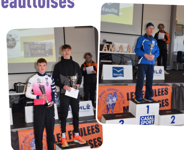
Bravo à tous les coureurs.

Félicitations à tous les bénévoles du club de l'AMAAC qui ont orchestré magnifiquement les différentes courses enfants et adultes.