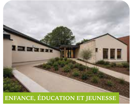
ENFANCE, ÉDUCATION ET JEUNESSE