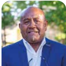
Patchuli SIPA Sécurité