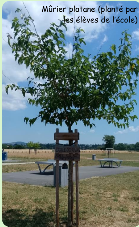
Mûrier platane (planté par les élèves de l'école)