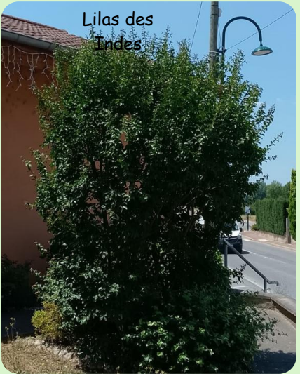
Lilas des Indes