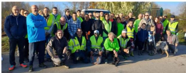
La motivation s'affichait avant le départ.

Les coureurs à pied de la Rivatière avec le soutien de la municipalité se sont activés pour nettoyer les sentiers après la crue.