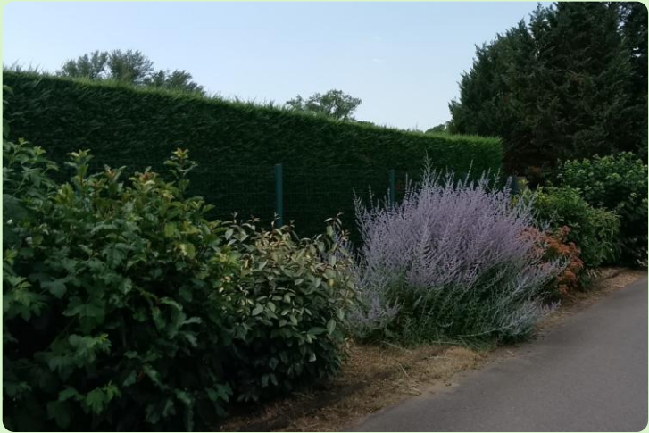
Hibiscus, Photinia, Noisetier, Spirée, Boule de neige, Buddleia