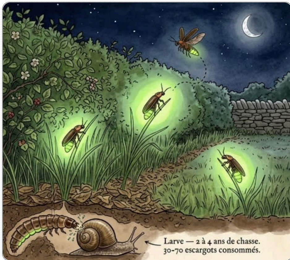
Larve — 2 à 4 ans de chasse. 30-70 escargots consommés.