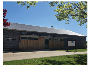
Dojo et Club House