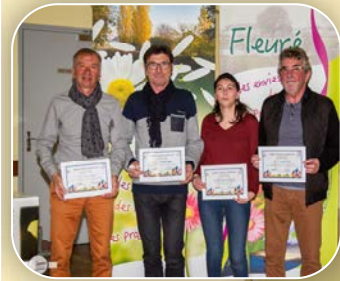
Manque : Hélène BOULINE

Une soirée bien agréable qui a permis aux nouveaux habitants de créer des liens avec les associations et la municipalité.