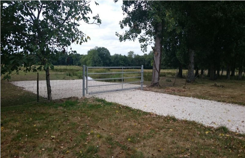
Lieu dit Tayat